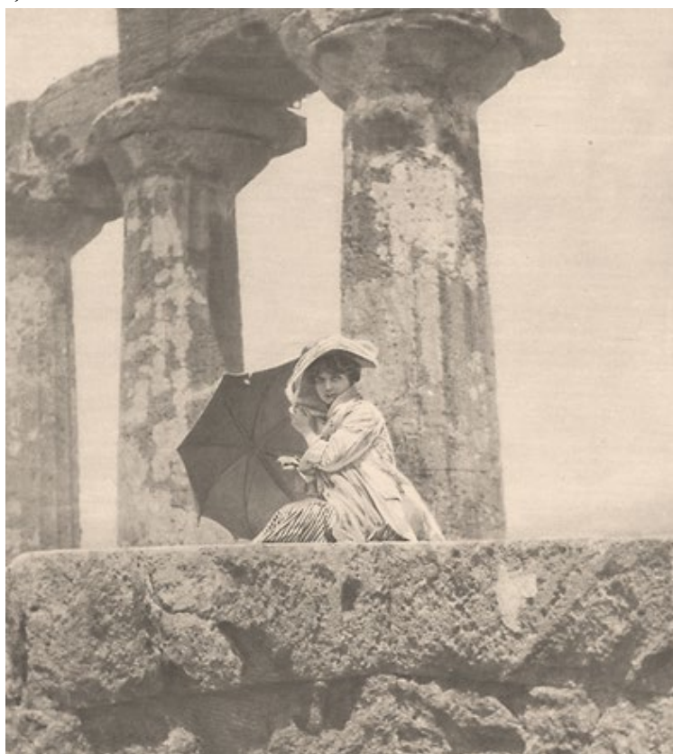
Image 13. Anna de Noailles en villégiature. Femina , 1 er août 1914.

interrogées figurent trois poétesses (Anna de Noailles, Gérard d’Houville et Lucie De- larue-Mardrus), trois actrices (Marcelle Géniat, Sarah Bernhardt et Réjane), une ro- mancière (Myriam Harry) et une danseuse (Natacha Trouhanova). Les femmes de lettres sont ici considérées comme des personnalités à part entière, au même titre que des artistes issues du monde du spectacle. La manière de les représenter est du reste très similaire. L’article est agrémenté d’une photographie en pleine page d’Anna de Noailles en villégiature en Sicile. La comtesse pose dans les ruines d’Agrigente, le regard tourné vers l’objectif, dans une mise en scène très étudiée.