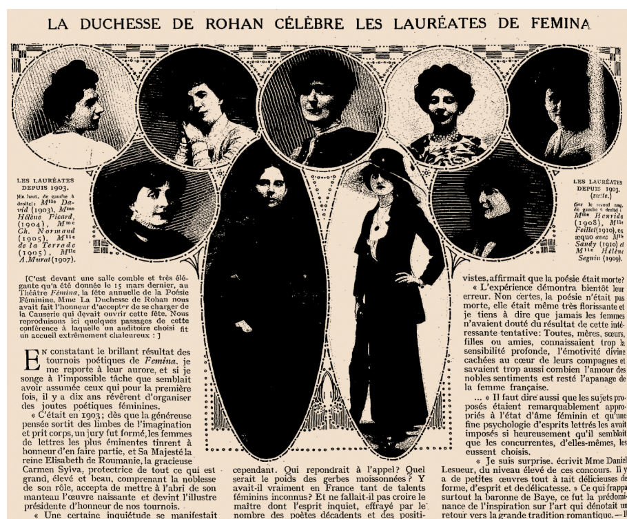
Image 12. Les lauréates du prix de poésie. Femina , 15 avril 1911.