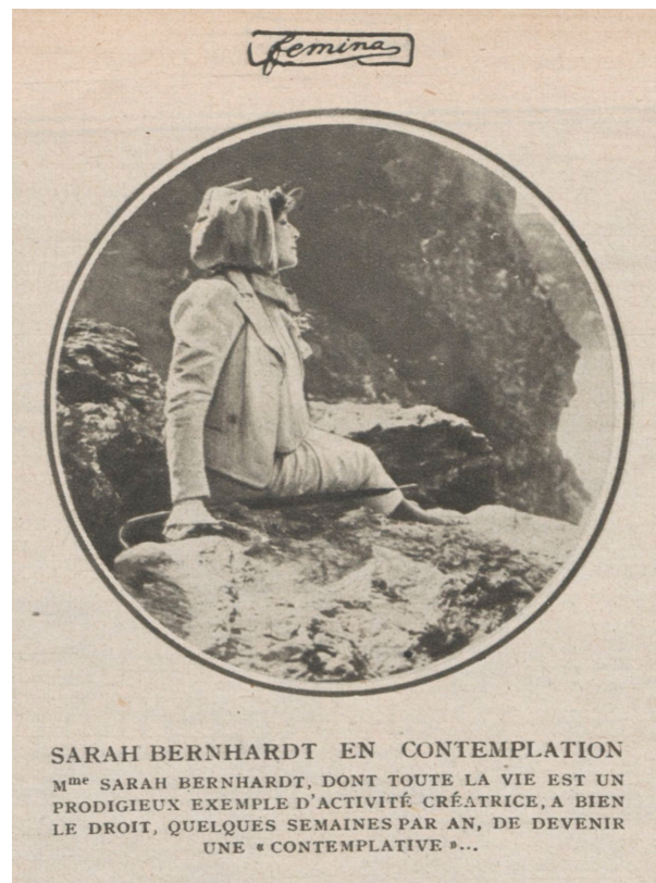
Image 14. Sarah Bernhardt à Belle-Île, Femina , 1 er août 1914.

La célébrité nouvelle à laquelle accèdent les femmes poètes a immanquablement son revers. Les Annales se font par exemple l'écho de l'émoi que provoquent, à l'été 1913, les caricatures d'André Rouveyre.