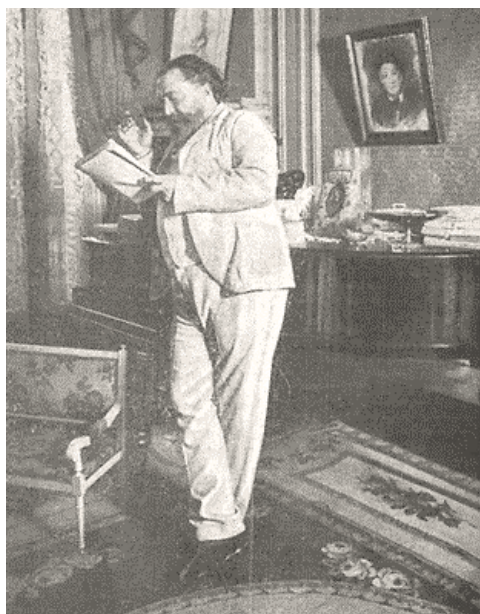
Image 6. Catulle Mendès corrigeant un manuscrit. Les Annales... , 11 novembre 1906.