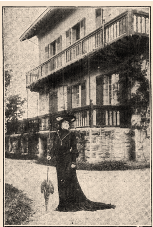
Image 2. Rosemonde Gérard devant la villa Arnaga. Les Annales... , 23 janvier 1910.

autrice 3 . Compagnes des gloires littéraires du temps, elles ne sont mises en lumière qu'en raison de ce statut, quelles que soient les activités qu'elles puissent mener parallèlement.