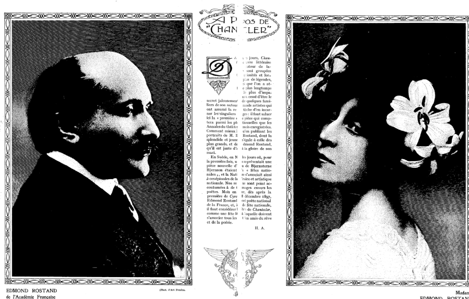
Image 1. Portraits d'Edmond Rostand et Rosemonde Gérard. Femina , 15 janvier 1910.

désignée non sous son nom de jeune fille qui est aussi son nom de plume, mais comme « Madame Edmond Rostand ». Par ailleurs, le court article inséré entre les portraits ne mentionne jamais son activité de poétesse. En somme, Rosemonde figure dans ces pages non pour ce qu'elle est, mais en raison du lien qui l'unit à Edmond. Elle se trouve ici strictement réduite à son statut d'épouse. Le montage photographique met du reste en scène le couple en tant que tel : les visages, tournés l'un vers l'autre à dessein, donnent le sentiment que mari et femme forment les deux moitiés d'un même tout.