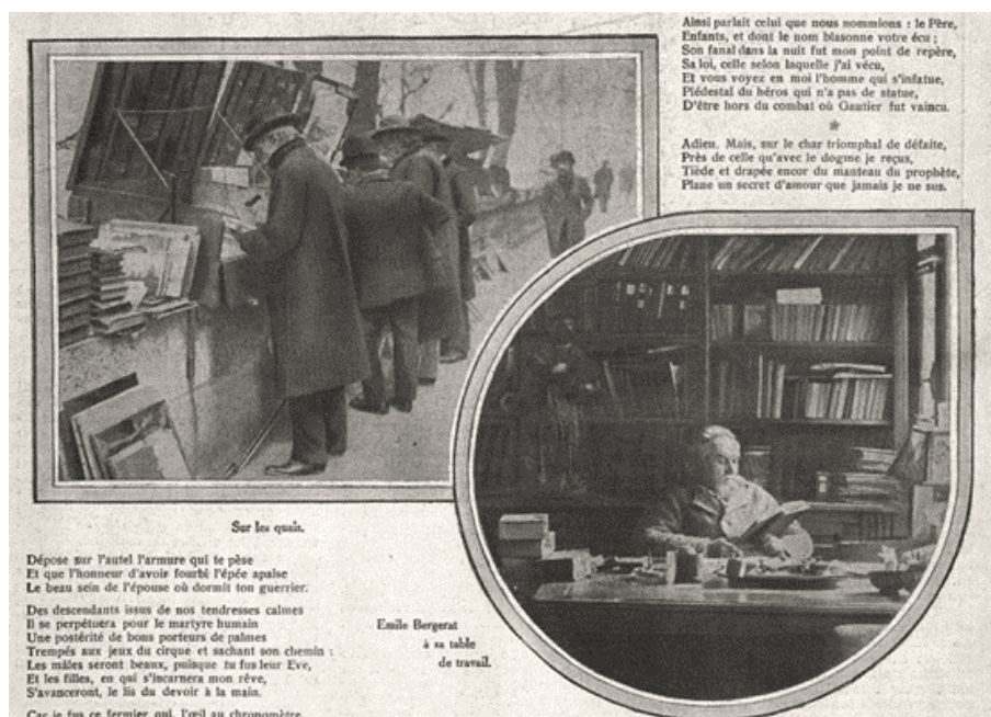
Image 7. Émile Bergerat. Les Annales... , 30 janvier 1910.

De la même manière, en janvier 1910, le journal suit Émile Bergerat, montré à sa table de travail et chez les