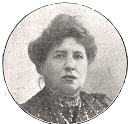
Image 4. M me Judith Gautier. Les Annales... , 6 novembre 1910.

Les Annales politiques et littéraires , qui relaient également cette élection inédite, ne font guère mieux. Un portrait photographique de Judith Gautier, d'une remarquable sobriété, illustre la nouvelle.