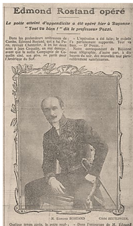
Image 9. Annonce de l'opération d'Edmond Rostand. Comœdia , 6 octobre 1907.

On le voit, jusqu'en 1910, le déséquilibre de traitement est flagrant entre les poétesses, toujours placées sous une tutelle masculine et ne bénéficiant d'une visibilité médiatique qu'en raison de cette aura, et les poètes, reconnus pour leur art et célébrés dans toute leur individualité.