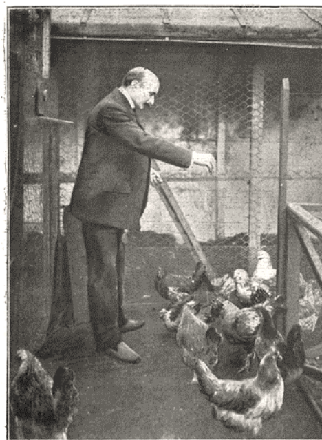
Image 8. « Le sosie d'Edmond Rostand ». Les Annales... , 20 février 1910.

Les personnalités littéraires bénéficient, au même titre que les autres, de ces nouveaux moyens de communication qu'il faut apprendre à apprivoiser. L'image fait vendre : elle constitue sans conteste une plus-value. Elle entre pleinement dans les stratégies publicitaires mises en place par les revues pour s'attirer de nouveaux lecteurs. Le cas d'Edmond Rostand est emblématique de cette révolution médiatique : nombreux sont alors les journaux qui tâchent de publier à son sujet des documents iconographiques inédits. Le 6 août 1911, Les Annales proposent ainsi à leurs lecteurs un portrait du poète jeune homme, alors qu'il était encore collégien à Marseille. Signe du degré de célébrité inédit auquel l'auteur de Chantecler a accédé, la même revue publie en guise de boutade, le 20 février 1910,