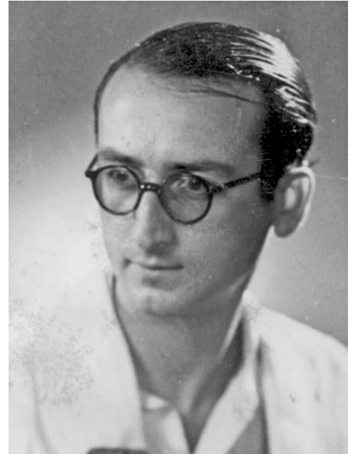
E. Charlot en 1936

Le comité du Centenaire Edmond Charlot et la Bibliothèque nationale de France s'associent pour lui rendre hommage à l'occasion du centième anniversaire de sa naissance, inscrit au rang des commémorations nationales de l'année 2015.