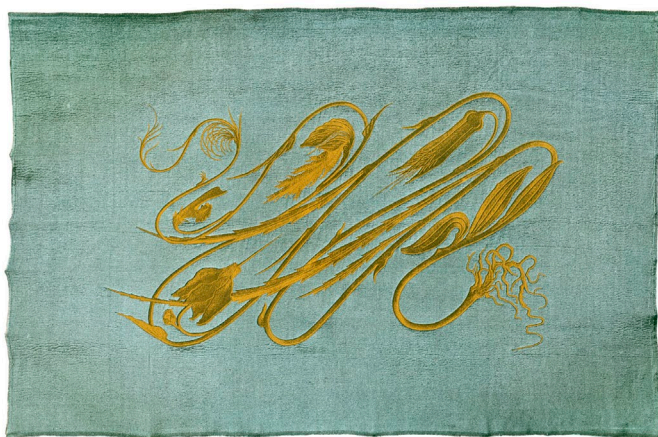
Fig. 1: Hermann Obrist (conception) et Berthe Ruchet (réalisation), [Großer Wandbehang mit Seidenstickerei], Grande tenture murale avec broderie au fil de soie, dit Peitschenhieb (coup de fouet), vers 1895, fil de soie doré sur tissu de laine vert-bleu-gris, broderie au point plat et au point de tige, photo de l'original, 1195 x 1835 cm, Münchner Stadtmuseum Munich, © LWL-Landesmuseum.

Cet article est consacré au mouvement de la ligne dans un objet singulier, qui à vrai dire ne se montre pas à nous comme un objet, comme une chose que nous pourrions tenir à distance : il nous absorbe plutôt, et nous plonge dans une vie intense où nous flottons quelque part entre subjectivité et objectualité.