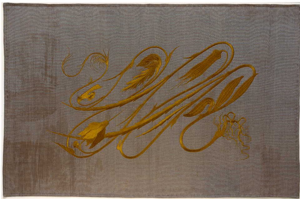
Fig. 3 : Hermann Obrist et Berthe Ruchet, [Großer Wandbehang mit Seidenstickerei], Grande tenture murale avec broderie au fil de soie, vers 1895, rénovée (rebrodée) sur un tissu de couleur différente, 1195 x 1835 cm, Münchner Stadtmuseum, document en ligne : < https://sammlungonline.muenchner-stadtmuseum.de/objekt/grosser-wandbehang-mit-seidenstickerei-peitschenhieb-10035267.html > © CC BY SA 4.0.

La piste végétale en elle-même toutefois ne nous mènera pas très loin. Dans l'angle opposé à ce qui semble être un cyclamen, c'est plutôt une graminée que nous identifions en haut à droite, et les feuilles en haut et au milieu ont une forme effilée qui ne ressemble pas vraiment à celle des feuilles d'un cyclamen. Il peut certes arriver que la forme des feuilles d'une même plante diffère selon leur position sur la plante ; mais l'allure générale ici se rapproche de celle d'une plante volubile (dont la tige s'enroule autour d'un support), ce qui ne correspond pourtant à aucune des fleurs présentes ici 3 . Enfin, la sorte de pique qui garnit la fleur de cyclamen est une invention, qui semble surtout destinée à accentuer la diagonale ascendante, énergisante, de l'ensemble de la ligne. On lit dans un carnet de Hermann Obrist cette injonction à l'intention de lui-même : « much more varied miscellaneous botany, don't systematize one botanical specimen 4 ». Du fait de cette pluralité intrinsèque, la « plante » n'est pas simplement là, elle se transforme devant nous, dans son développement qui