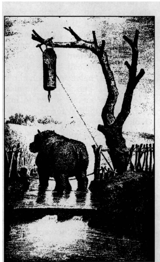
Piège à hippopotame, Thomas Boteler, 1835. Narrative of a voyage of Discovery to Africa and Arabia. Vol. 1.

Rien n'empêche la captologie sauvage de puiser à toutes les sources, low tech , high tech ou wild tech 4 pour concevoir des pièges à particules. Elle pourrait bien trouver son inspiration aussi dans l'histoire des pièges les plus traditionnels. Les pièges de chasse et les techniques de collecte auxquelles s'intéressent les anthropologues depuis longtemps pourraient bien inspirer les designers. Edouard Mérite, professeur de dessin au Muséum d'histoire naturelle, dans son Histoire et techniques de piégeage à travers le monde (1942) classe les pièges en trappes, filets, nasses, collets, trébuchets, traquenards, assommoirs, arbalètes, gluaux, appeaux, leurres, similitudes, hameçons, poisons.