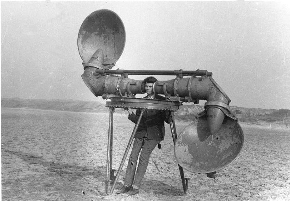
Radar acoustique tchèque, vers 1920

A quoi un arbre est-il sensible et comment une écorce de neem peut-elle devenir un piège à particules pour mesurer la pollution environnementale ? Tel est l'enjeu du