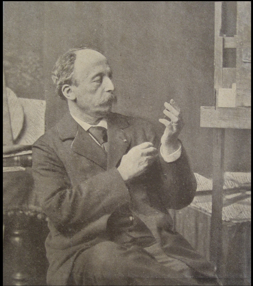
Oscar Roty dans son atelier vers 1890, héliogravure In Les Annales , n° 1478, p. 401