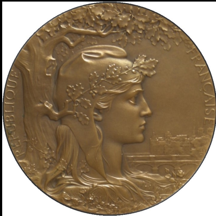
Jules-Clément Chaplain Récompense de l'Exposition universelle de 1900