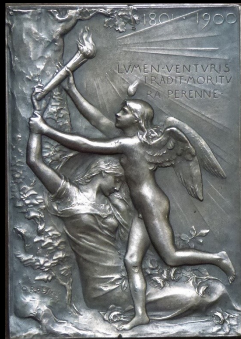
Louis-Oscar Roty Plaquette commémorative de l'Exposition universelle de 1900