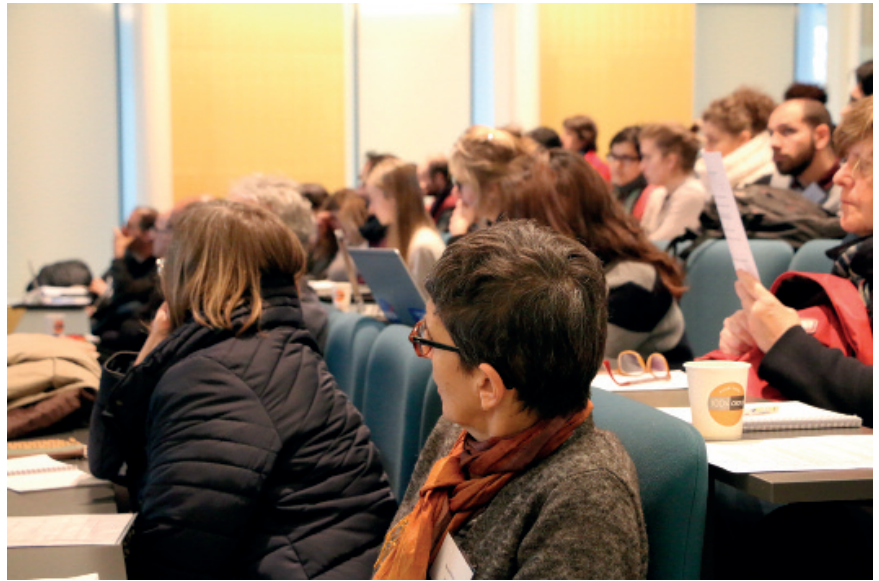
Figure 1. Près d'une centaine de personnes réunies à Jussieu pour faire le point des connaissances sur les cyclones.

– informer les acteurs non scientifiques par leur participation au séminaire et par les publications qui suivront; – mobiliser la communauté scientifique autour de questions de recherche sur l'observation, la compréhension et la