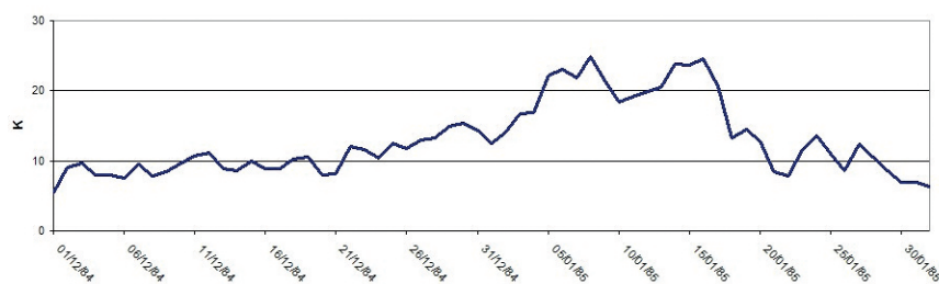
Figure 2. Évolution de l'indicateur degré-jour de chauffe unifié pour la période de décembre 1984 à janvier 1985 marquée par une vague de froid.

Si l'objectif initial était de développer un démonstrateur de service climatique pré-opérationnel pour le secteur de l'énergie, l'interaction avec les utilisateurs a soulevé de nouvelles questions scientifiques. Par exemple, plusieurs producteurs d'énergie éolienne ont constaté une baisse de la vitesse du vent dans les dernières années. Comment interpréter cette plus faible production ? Variabilité interdécennale, rugosité accrue due à l'urbanisation et à davantage de forêts, changement climatique... plusieurs pistes sont à explorer.