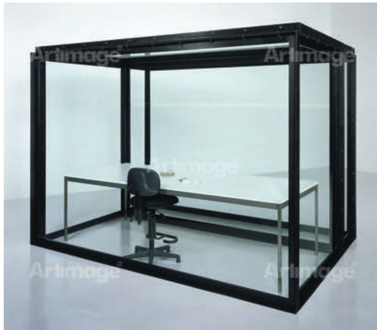
→ The Acquired Inability to Escape , Damien Hirst, 1991