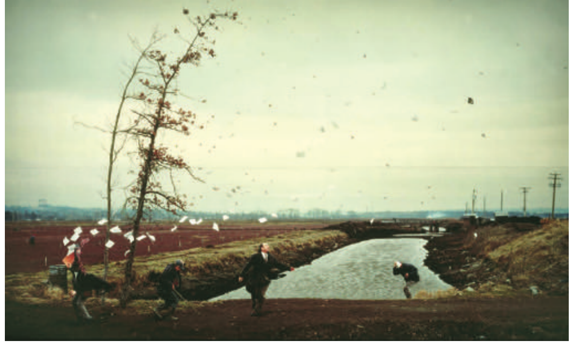
→ A Sudden Gust of Wind (after Hokusai), Jeff Wall, 1993

Malgré la profondeur historique et la subtilité sociologique de tels diagnostics, il faut se rendre à l'évidence : nous n'avons pas de solution. En dépit de l'effort opéré pour conscientiser des mécanismes d'envoûtement que nous avons pointés et que Graeber résume par l'expression d' attrait de la bureaucratie , aucune formule magique pour résoudre le problème ne semble envisageable, rien n'apparaît qu'un empilement de nouvelles structures, de nouveaux dispositifs, de nouveaux formulaires qui compliquent souvent les choses au lieu de les simplifier. C'est qu'il manque à ces auteurs, sans doute paralysés par la complexité du phénomène et qui fondent leur réflexion sur la bureaucratie de leur temps à partir de l' observation et de l' enquête , de nous donner à sentir ce qu'il faudrait pour que nous puissions reconquérir