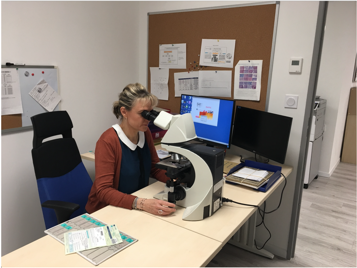
Figure 3 : le poste de travail d'un médecin analyste

Concernant l'utilisation de cet outil, les techniques des anatomopathologistes sont hétérogènes : nous parlons de screening effectué pas à pas, deux par deux, ou de manière globale. Cependant, d'une part, les screenings respectent la cartographie de la prostate, et, d'autre part, tous les médecins cherchent les signes de présence du cancer et une fois ces signes trouvés les catégorisent. Dans ce contexte, la pensée semble en tension entre l'hypothético-déductif et l'induction, voire l'abduction, pour mieux contrôler ce qui est en train d'être fait : le demandeur de l'analyse suspecte un cancer (hypothèse), l'anatomopathologiste cherche des critères morphologiques sur la lame d'histologie, qui permet de formuler un diagnostic (déductif). Dans le cours de l'analyse, le grading évolue dans le temps suite au repérage de critères