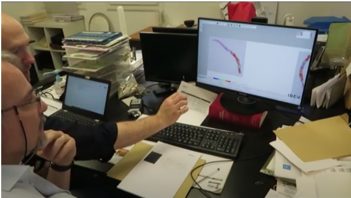
Figure 2 : séance de formation par IBEX dans les locaux de MEDIPATH et démarche de design-thinking

pratique de l'anatomopathologie prostatique au microscope, non assistée par une IA). Notamment, ces besoins concernaient l'analyse et la validation des informations successives nécessaires à l'établissement du diagnostic et du compte rendu final, ainsi que la présence de fonctions annexes pour faciliter l'exercice de l'analyse (règles pour mesurer, raccourcis claviers) ou reproduisant des fonctions de navigation de base nécessaires à l'analyse visuelle fine (zoom à différentes échelles, déplacement sur les biopsies, etc.). Cette démarche a été fortement appréciée par l'ensemble des médecins parce qu'ils l'ont trouvée bienveillante. Elle aura permis d'aboutir à un produit final, dont l'utilisation est jugée ludique et agréable.