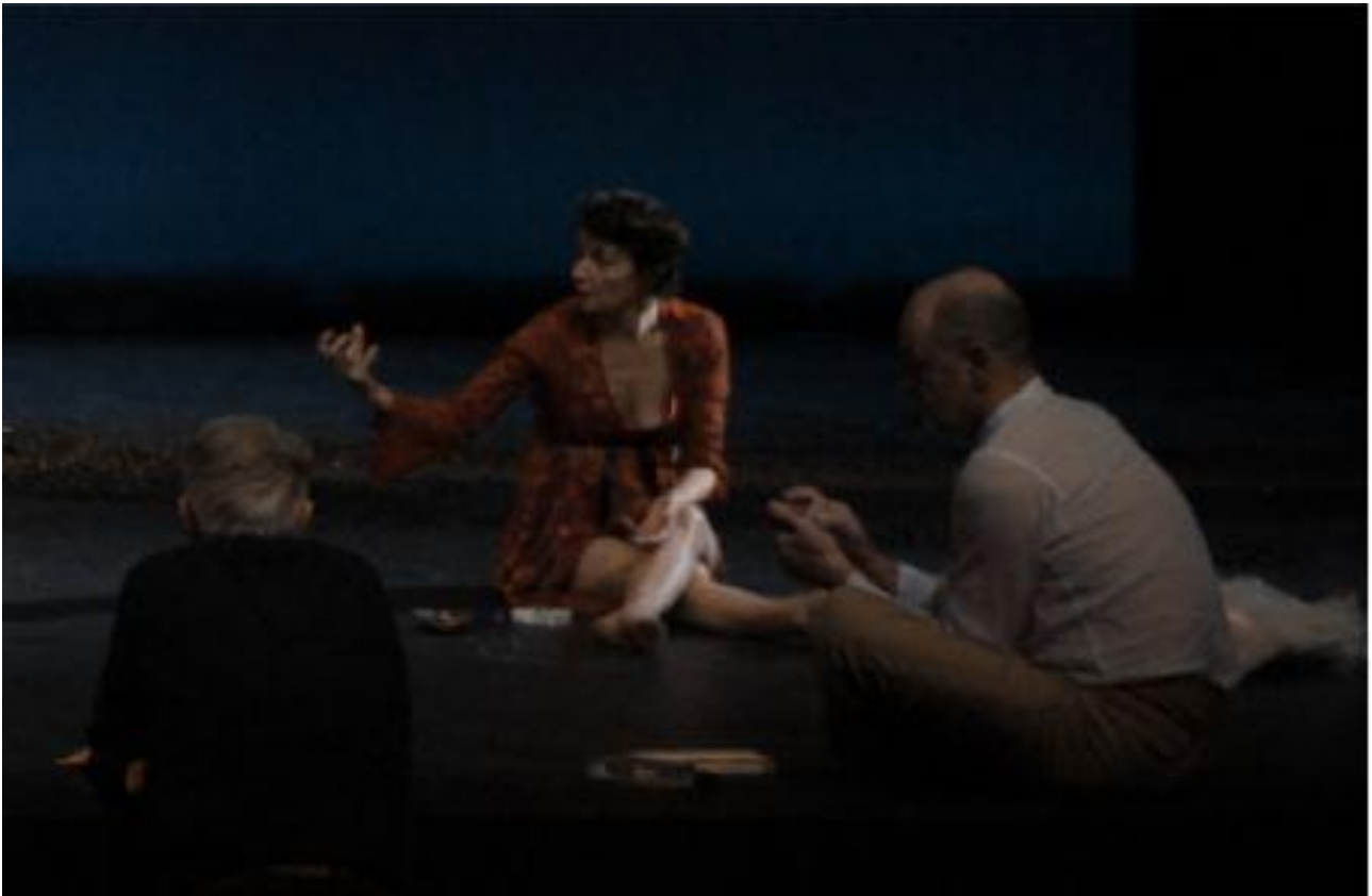
[Figure 6 : Sous le regard de KinoAI, le plateau redevient table de travail pour la dernière semaine de répétitions.]

en mettant l'accent sur la reconstitution dramaturgique à travers les panneaux de texte qui viennent rythmer son épisode 24 .