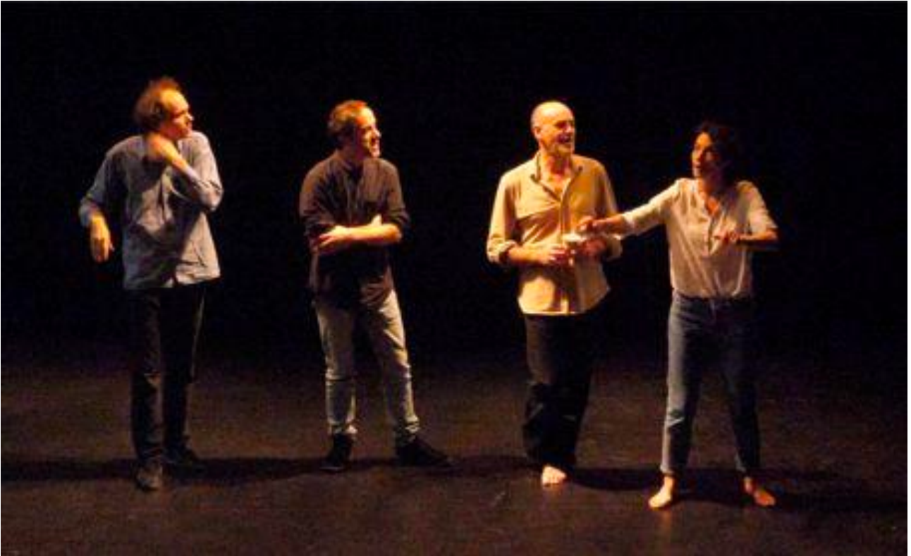
[Figure 4. Premières improvisations des quatre acteurs de La fabrique des monstres sur le plateau, après recadrage par KinoAI (épisode 1).]