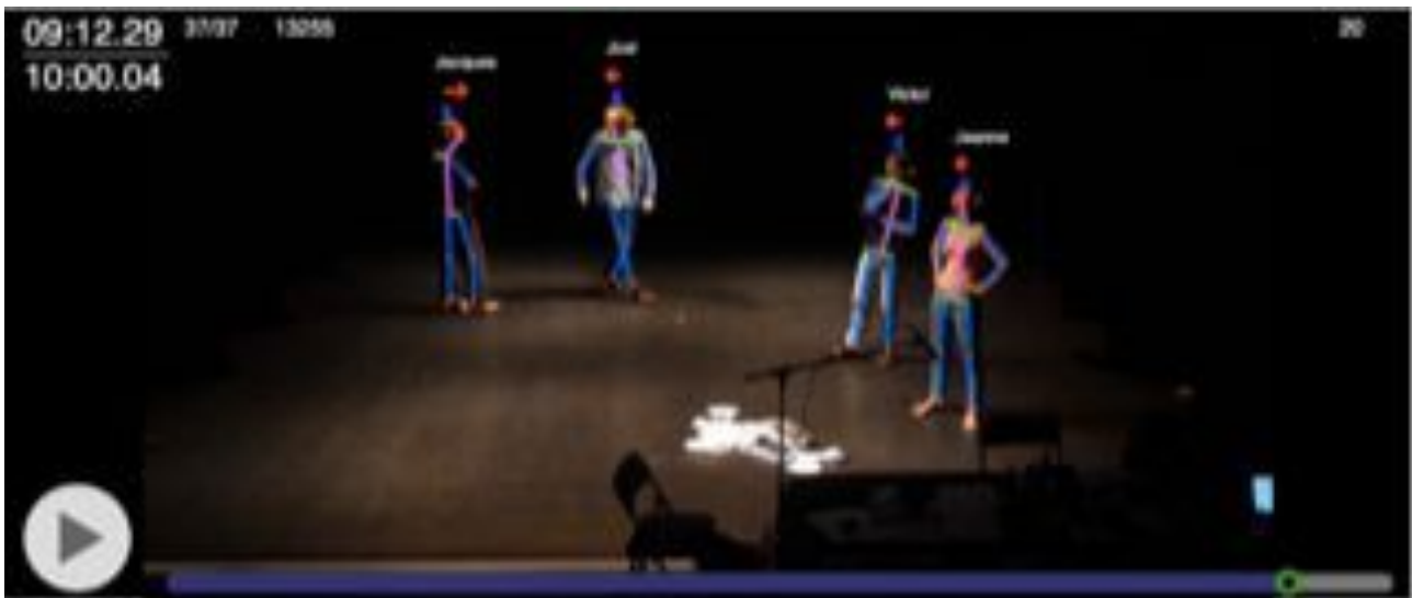
[Figure 3. Détection des parties du corps des quatre acteurs à l'aide du logiciel OpenPose. Les informations ainsi extraites permettent à KinoAI de calculer tous les cadrages possibles en post-production.]