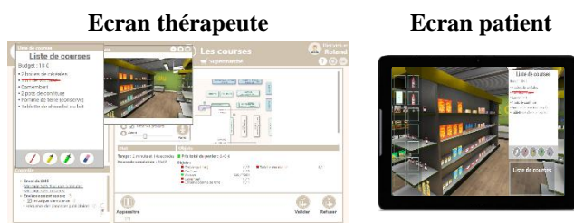
Figure 2. Solution COVIRTUA Cognition

COVIRTUA Cognition© est un logiciel d'entraînement des fonctions cognitives comprenant des exercices visant à travailler une fonction cognitive spécifique et des exercices simulant des activités de la vie quotidienne à travers la réalité virtuelle.