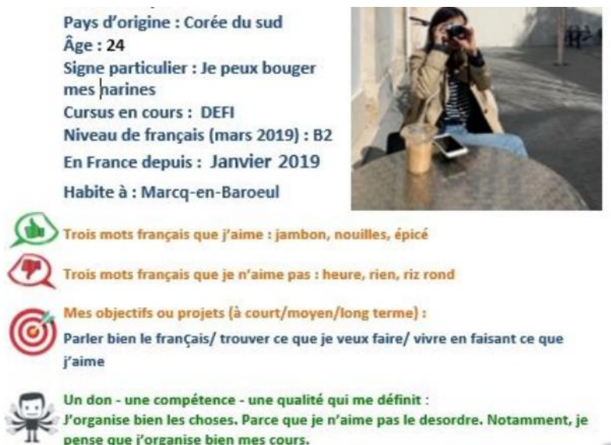
Tableau 5. Extrait d'un portfolio – profil

À titre d'exemple, les extraits suivants sont tirés du portfolio de l'étudiante coréenne ayant rédigé le billet sur le Chtimi Rock – en l'occurrence son profil et les commentaires qu'elle a postés.