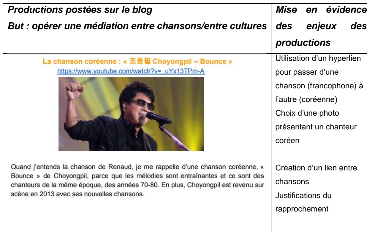
Tableau 3. Ch'timi rock (partie 2) – But : opérer une médiation entre cultures.