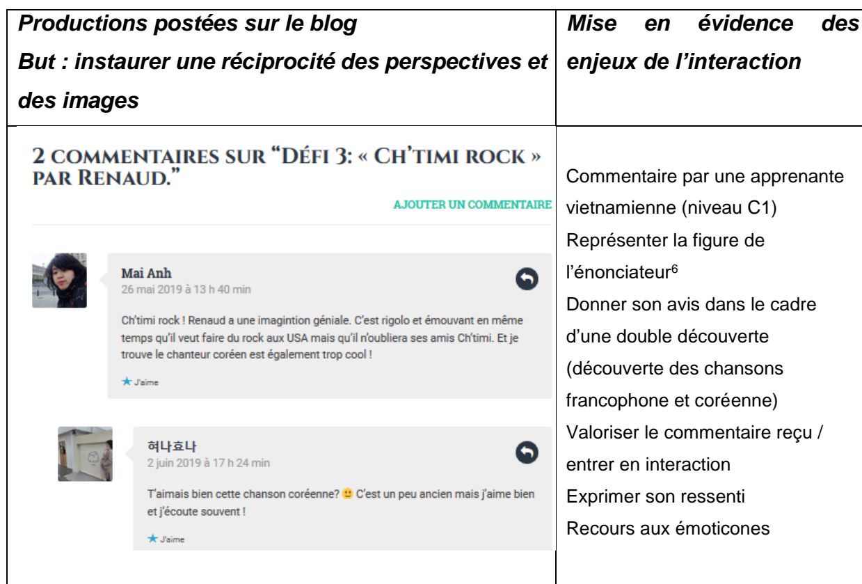
Tableau 4. Deux commentaires – But : Instaurer une réciprocité des perspectives et des images.

Au cours de l'interaction entre apprenantes coréenne et vietnamienne autour des commentaires sur le billet posté, chaque participante prend soin de constituer sa partenaire en participant digne de considération et de coopération, sans nécessité de thématization ni de négociation. Un tel travail permet l'expression des émotions, soutenue par le recours aux émoticônes, et facilite la médiation à différents niveaux (selon le Volume complémentaire du CECR , 2018), entre apprenants internationaux, selon l'exemple donné de l'interaction menant de Renaud à Chyongpil :