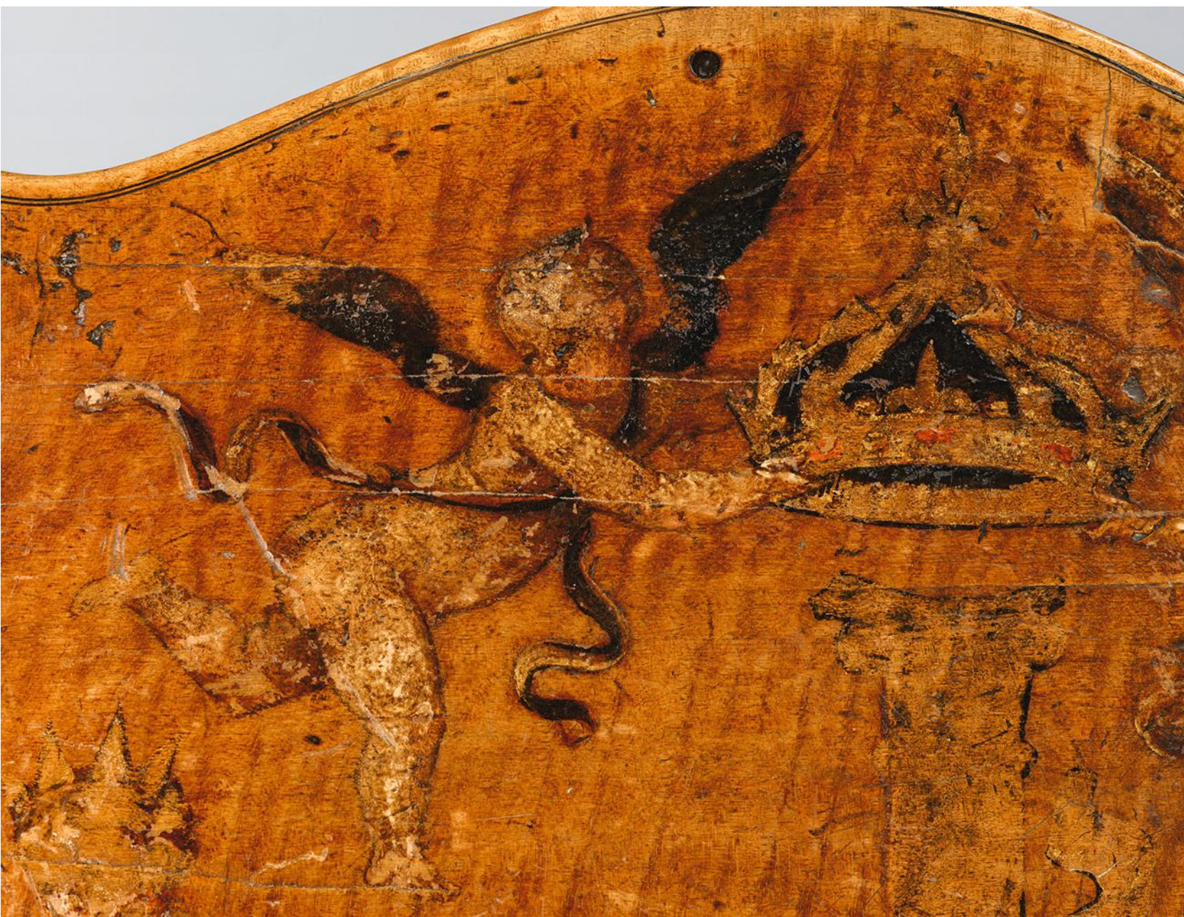
5. Détail de la fig. 2 : un angelot.