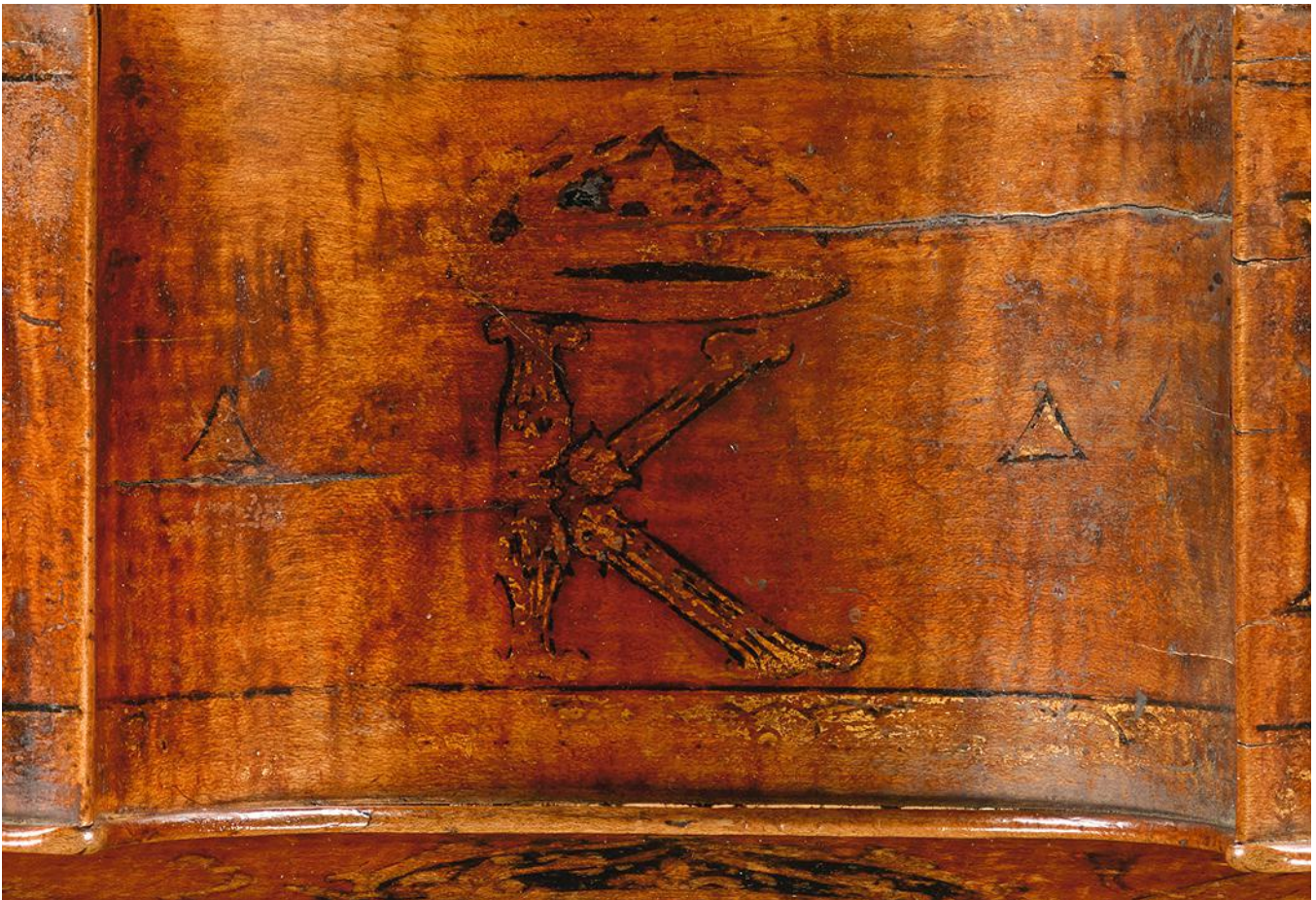
4. Vue de détail de l'éclisse du côté des cordes graves.

Les traces des fixations de tels crochets sont encore bien visibles en trois emplacements sur le dos.