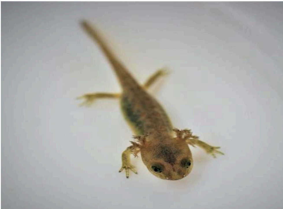
Figure 3. – Têtard de salamandre algire (Tamridjet, Béjaïa : Algérie).