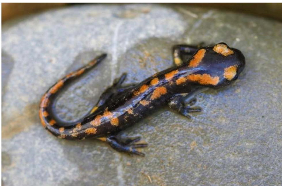
Figure 1. – Salamandra algira algira (Tamridjet, Béjaïa : Algérie).