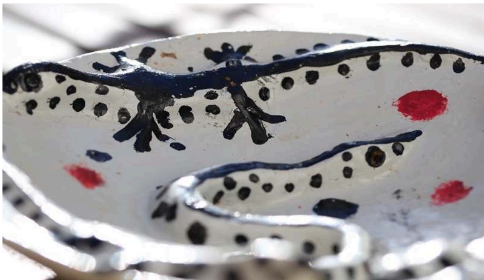
Figure 6. – Figure de la salamandre à côté d'une couleuvre sur une poterie représentant les « gardiens de l'eau » (Tamridjet, Ait Bouyef, Béjaïa : Algérie).

africaines que nous décrirons ci-dessous. Après quoi nous nous attarderons spécialement sur la place de cet animal dans la littérature orale à travers quelques dictons et devinettes.