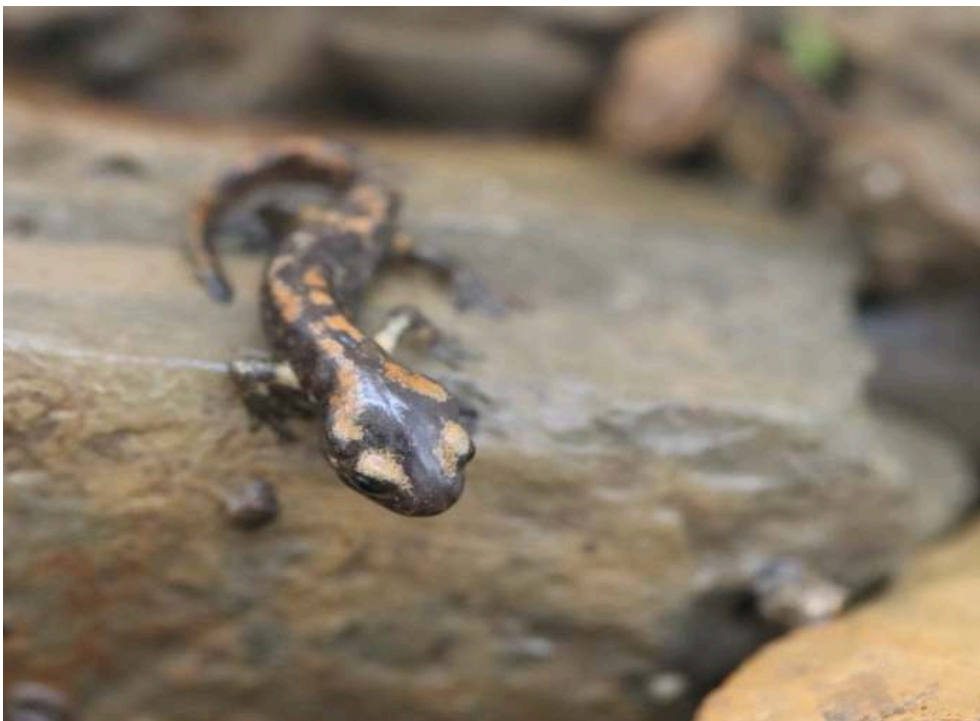
Figure 4. – Juvénile de Salamandra algira algira (Aokas, Béjaïa : Algérie).