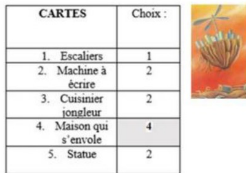
Figure 4 : Cartes choisies quant à la représentation de la mise en place de l'entreprise libérée