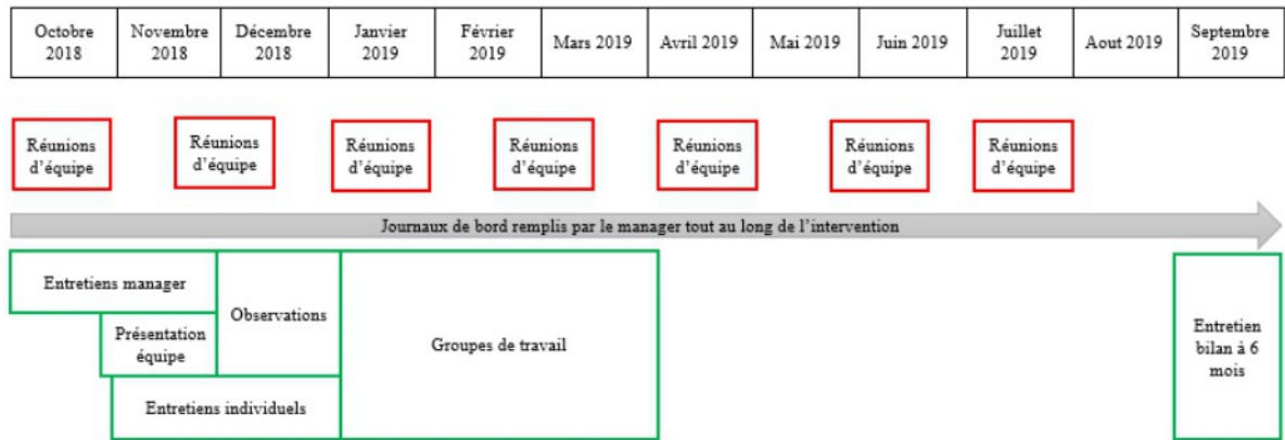
Figure 1 : Méthodes mises en œuvre