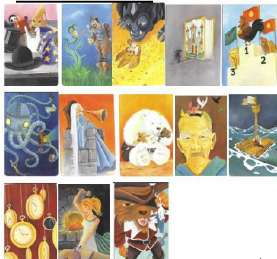
Figure 2 : Cartes pour interroger sur le métier