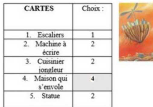
Figure 4 : Cartes choisies quant à la représentation de la mise en place de l'entreprise libérée