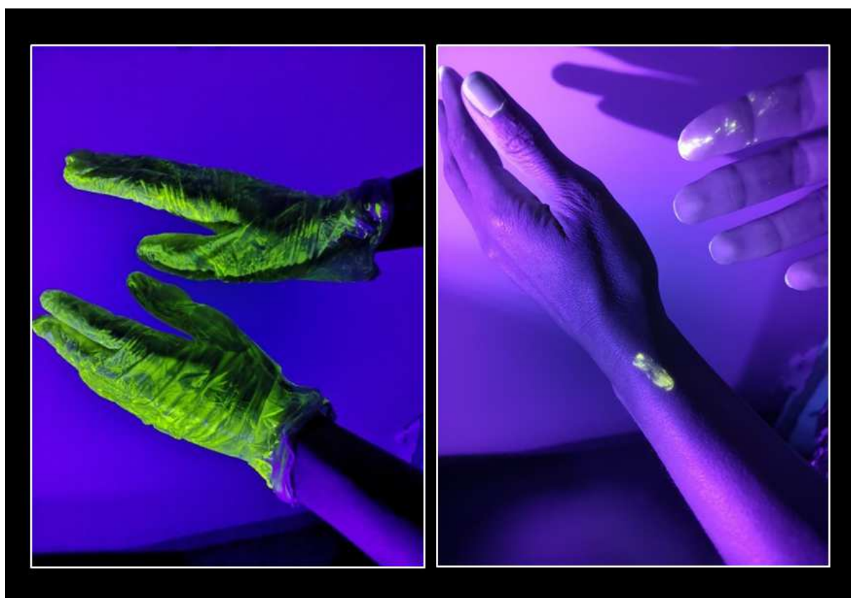
Figure 2. Gants et contamination. Photo A : contamination de l'environnement liée à l'utilisation de gants contaminés lors d'un soin et non ôtés. Photo B : contamination des mains lors du retrait de gants.

Ces approches combinées permettent de minimiser les limites des prélèvements de surface.