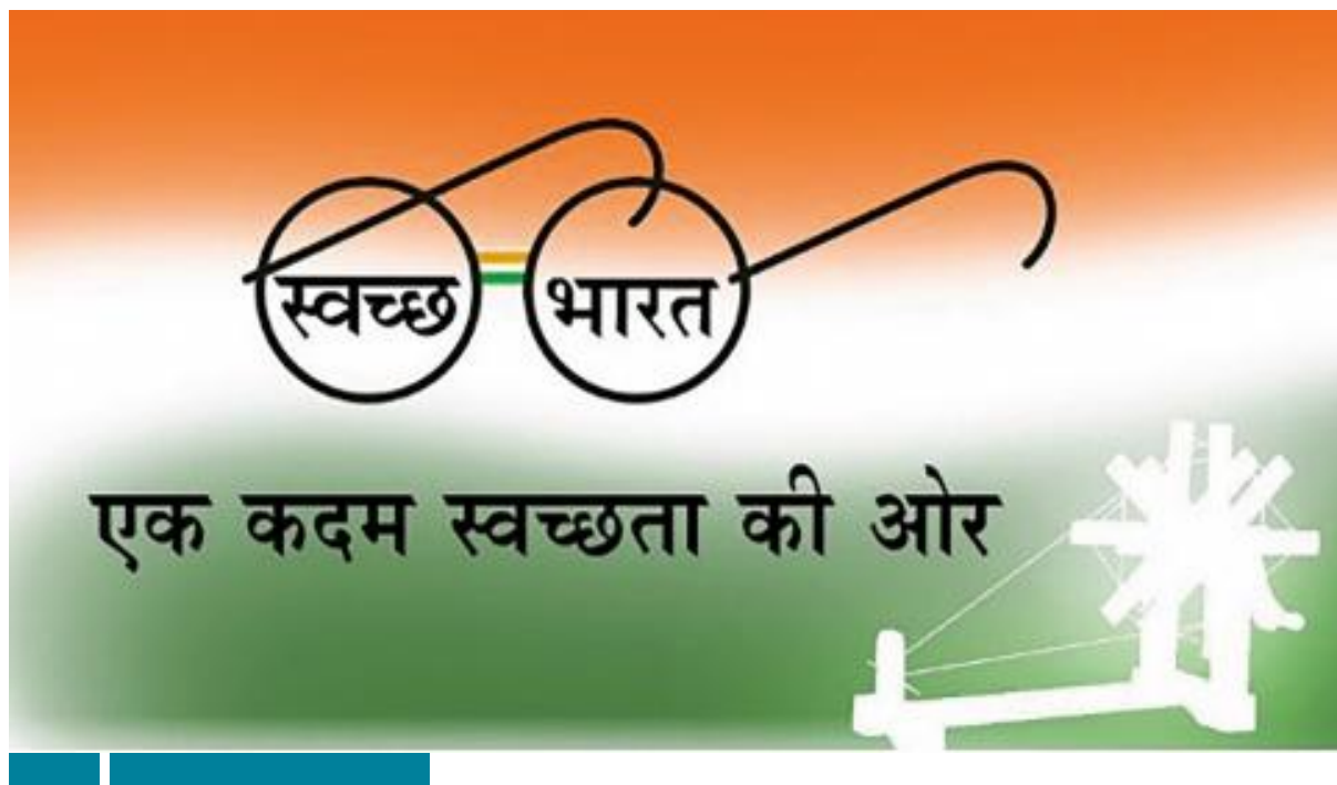
Figure 1 – « Swachh Bhârat Abhiyan »

1En Inde, le 2 octobre 2019 se clôturait la première phase de la mission « Nettoyer l’Inde » ( Swachh Bhârat Abhiyan ), lancée 5 années auparavant avec l’ambition d’améliorer la gestion des déchets. La date choisie du 2 octobre n’est pas anodine car elle correspond au 150 e anniversaire de la date de naissance de Gandhi, figure tutélaire de la nation indienne, afin d’inscrire symboliquement la question de la pollution comme une priorité nationale. Puissance désormais incontournable sur la scène internationale, l’Inde peine à contrôler les effets pervers d’un développement économique, certes rapide, mais qui génère toujours plus de déchets et de pollution. Moteurs de la croissance indienne, les villes indiennes produisent au moins 125 000 tonnes de déchets par jour (CPCB, 2012) que le gouvernement peine à éliminer malgré la mise en place de politiques publiques spécifiques. D’une manière générale, la législation relative à la gestion des déchets municipaux en Inde (éditée en 2000 et mise à jour en 2016), n’a dans les faits jamais pu être réellement appliquée en pratique et la problématique environnementale reste plus que jamais d’actualité. Le programme « Nettoyer l’Inde » de Narendra Modi reprend peu ou prou l’action des précédents gouvernements qui avaient déjà lancé des programmes similaires, tout en le médiatisant cette fois-ci de manière beaucoup plus habile et vigoureuse (cf. fig. 1) mais sans pour autant parvenir à améliorer notablement la situation.