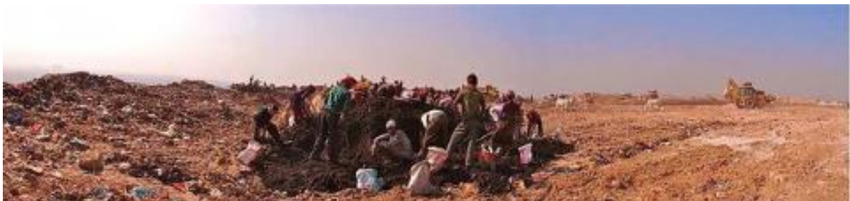
Figure 3 – Fouiller le reste du reste, pour extraire les métaux ferreux des mâchefers

Afin d’éviter au maximum l’enfouissement dans les décharges, la ville de Delhi s’oriente désormais vers l’incinération de ses déchets municipaux. Après combustion, il reste néanmoins toujours un quart du volume initial, réduit sous forme de mâchefers. Devant théoriquement être recyclés sous la forme de briques de construction, ces résidus toxiques terminent en réalité en décharge autour desquels s’acharnent des récupérateurs. Simplement armés de gros aimants, ils frappent lourdement les lourdes cendres noires pour en extraire le métal ferreux, la dernière matière valorisable qu’ils pourront revendre à un ferrailleur.