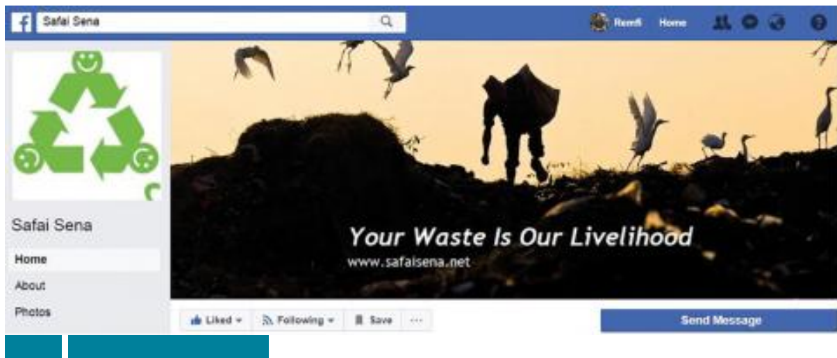
Figure 8 – « Your waste is our Livelihood » (« vos déchets sont notre gagne-pain »)