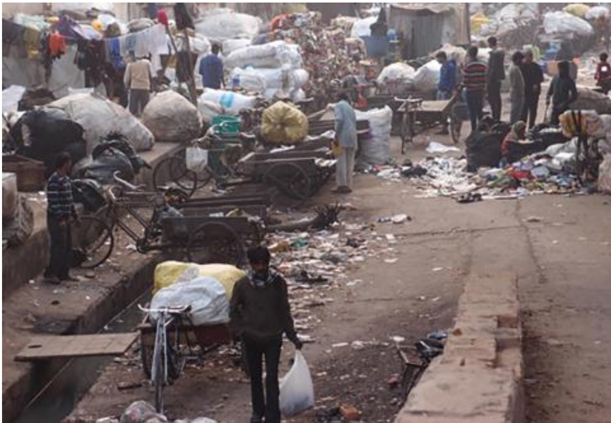
Figure 2 – Fin d’après-midi dans un quartier de récupérateurs

C’est la fin de l’après-midi à Hanuman Mandir, les charrettes ont été vidées mais le tri des déchets n’est pas encore terminé et les uns et les autres s’affairent à terminer le travail entre les rickshaws (charrettes à pédales). La marginalisation spatiale des populations hors caste a toujours existé en Inde, mais elle est socialement accentuée par le stigma lié à l’impureté de l’ordure qui s’étend à tout le bidonville. Vivant dans des conditions de vie déjà difficiles, les récupérateurs doivent composer