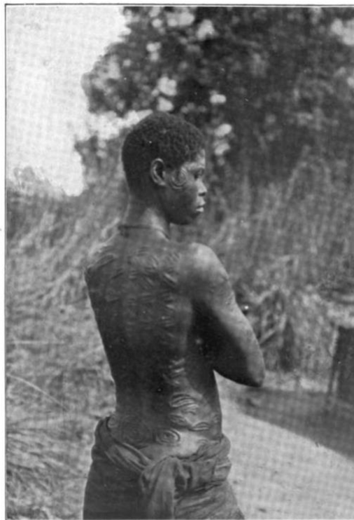
Meine beste Märchenerzählerin vom Sankuru, eine Banfutufrau