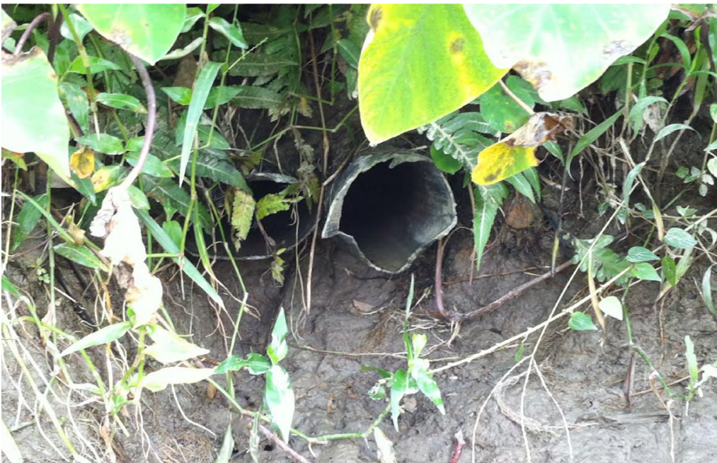
Image 4 : Une prise directe illégale dans la digue d'un canal.