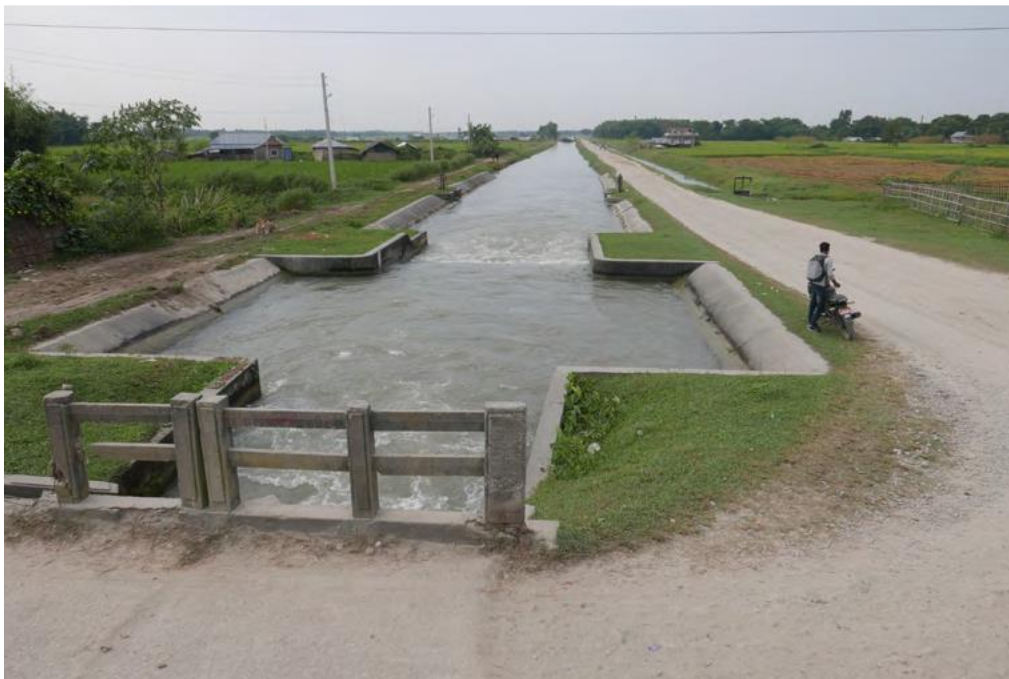
Image 2 : Le canal de Sitaganj dans sa partie amont. Cliché : R. Valadaud, 2017.