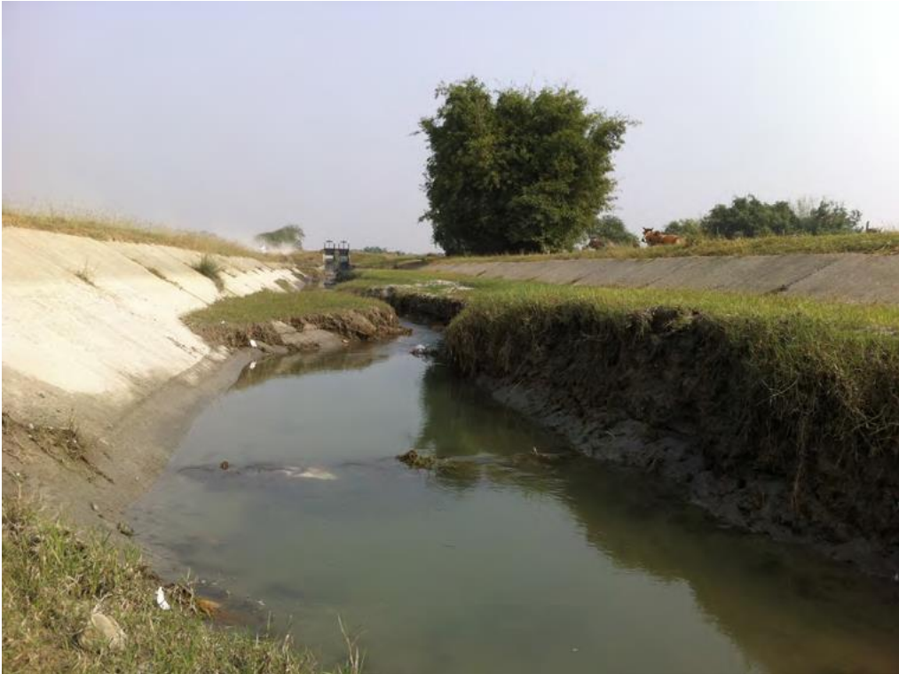
Image 3 : Sitaganj dans sa partie aval, partiellement ensablé. Cliché : R. Valadaud, 2017.