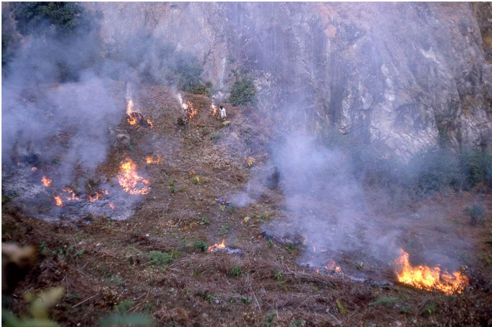
FIG. 2 – Les brûlis

Cliché Philippe Sagant, 1966-1967 ; source : LESC_FPS_7.1.1