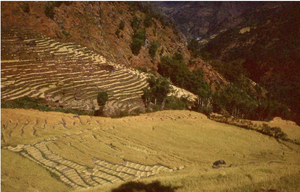
FIG. 1 – Champs en terrasses, moissons