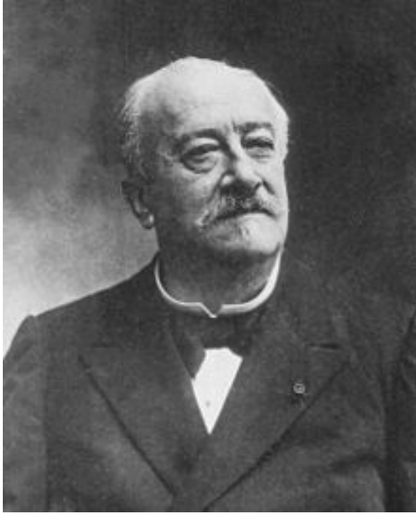
Figure 1. Jean-Alfred Fournier (1832-1914), Professeur de dermatologie et vénérologie à la faculté de médecine de Paris.