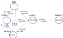
Figure 1 : Modèle structural – Coefficient de détermination (R2)