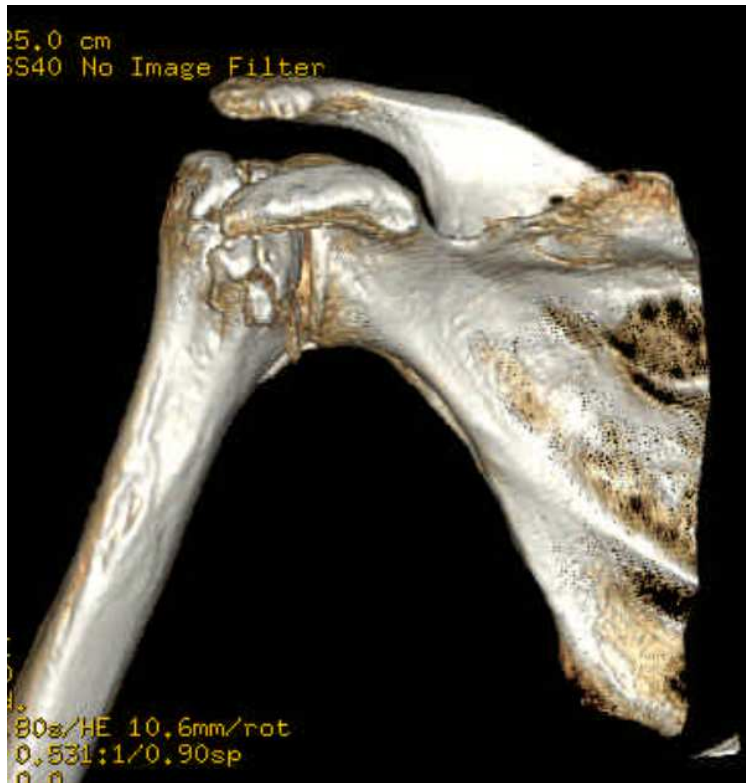
Figure 3 : reconstruction 3D du scanner de la face antérieure de l'épaule droite : fracture comminutive de l'extrémité supérieure de l'humérus droit