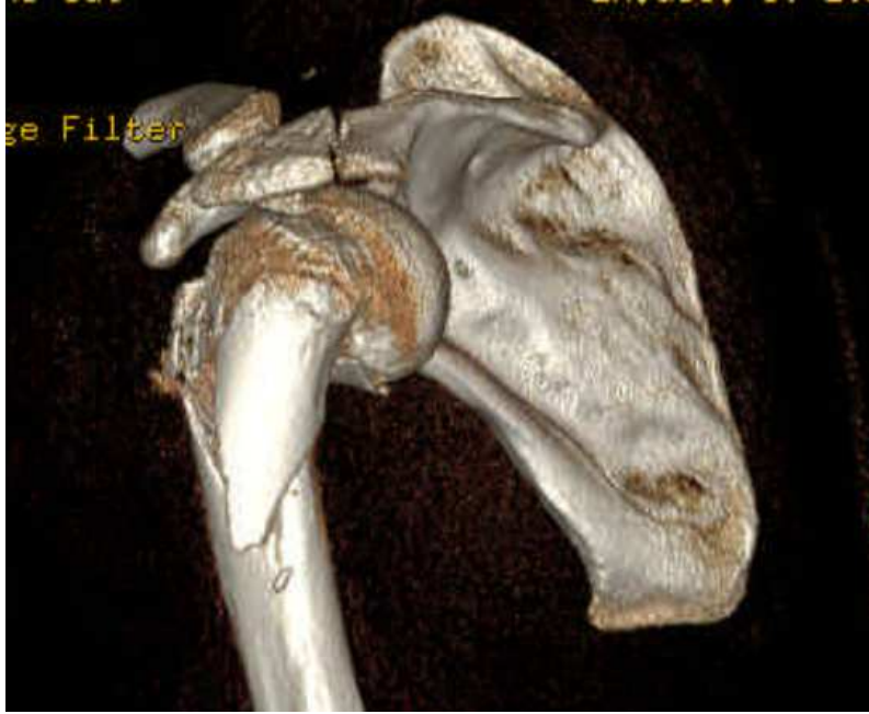
Figure 2 : reconstruction 3D du scanner de la face postérieure de l'épaule gauche : fracture comminutive de l'extrémité supérieure de l'humérus gauche et fracture de l'acromion