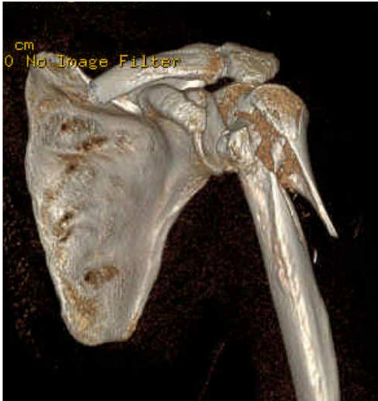
Figure 1 : reconstruction 3D du scanner de la face antérieure de l'épaule gauche : fracture comminutive de l'extrémité supérieure de l'humérus gauche