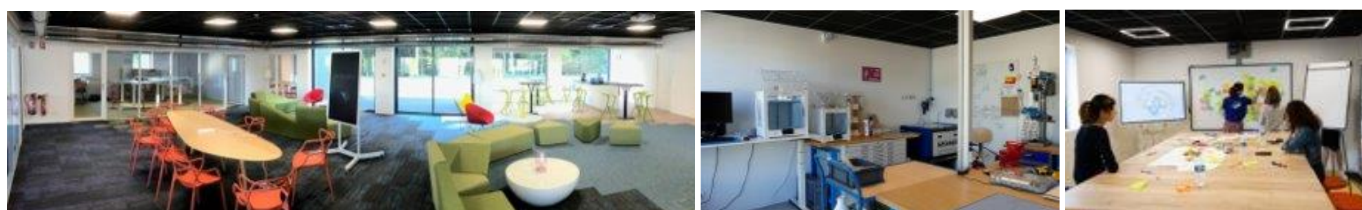
Clean Mobility Lab de Faurecia Clean Mobility

« Un lieu et une démarche portés par des acteurs divers, en vue de renouveler les modalités d'innovation et de création par la mise en œuvre de processus collaboratifs et itératifs, ouverts et donnant lieu à une matérialisation physique ou virtuelle ». (V. Merindol et al., 2016)