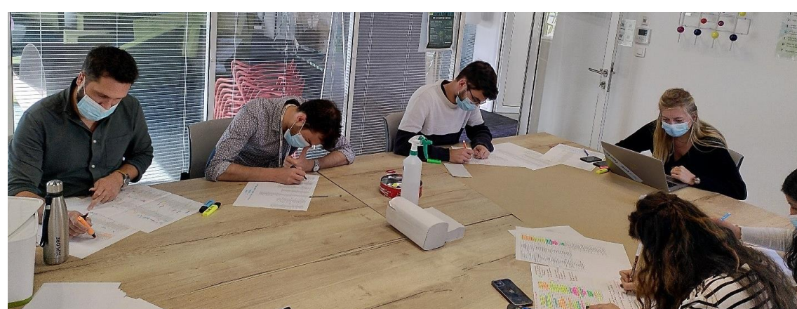
Expérimentation autour des guidelines