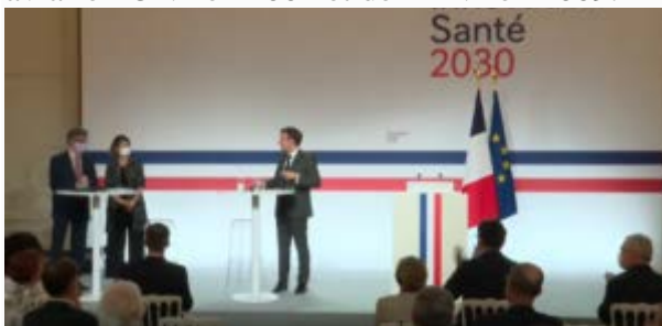
Présentation de la stratégie innovation santé 2030 par le Président Emmanuel Macron. Juin 2021.

Le covid19 a définitivement brisé la double assurance qui soutenait ce modèle. La première était la confiance dans la capacité à mettre rapidement au point des remèdes ou vaccins en cas de grave poussée infectieuse. La seconde imaginait, sur la base du précédent du VIH-Sida dans les années 1980, qu'aucune émergence d'un nouvel agent infectieux ne prendrait l'ampleur d'une pandémie mondiale capable de décimer des populations. Le plan de préparation que l'Organisation mondiale de la santé (OMS) recommanda en 1999 n'invalidait pas cette représentation (1) . Certes, après le coup de semonce de l'épidémie du sous-type H5N1 de la grippe A (Hong Kong, 1997), il n'excluait pas une pandémie de grande ampleur, avec des mesures de cantonnement importantes au cas où la réponse vaccinale durerait plus d'un an. Mais l'anticipation se centrait sur la grippe, pour prévenir ses épisodes potentiellement les plus sévères. Et le plan suivait aussi une logique de communication en santé publique, en visant à éviter les paniques qu'avaient suscitées de « fausses alertes » depuis les années 1970. Cette vision des choses n'était pas remise en cause par la portée limitée de l'épidémie de grippe aviaire H5N1 en 2004 et de H1N1 en 2009.