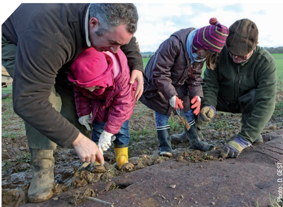
La protection des espèces passe par la sauvegarde des habitats.

J'ai des réserves expresses, par exemple, pour qualifier d'écologiques les lâchers annuels de "poulettes" et le renforcement des populations de lièvre par des animaux d'élevage. Visant à compenser artificiellement des prélèvements excessifs, ils conduisent à homogénéiser et à dénaturer la génétique des populations locales, compromettent donc leur évolution darwinienne, adaptative, et favorisent la prédation des espèces concernées et la propagation de maladies.