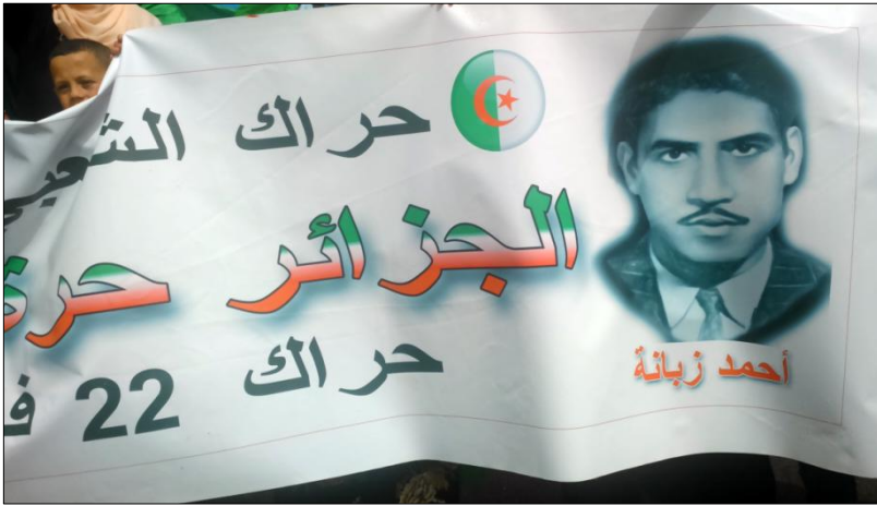
Figure 2 : Photo de Zabana sur une pancarte lors d'une manifestation du hirak. Oran, mars 2019

Il n'est pas rare de voir apparaître, dans les foules d'Algériens mobilisées sur l'ensemble du territoire, des photos et des cartes de mujâhid collées sur des panneaux de fortune (et poignants) de héros anonymes qui n'ont pas eu à bénéficier de la reconnaissance nationale et des privilèges qui vont avec 12 (Dirèche, 2018).