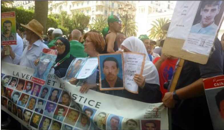
Figure 3 : Manifestation des familles de disparus, Place de la Grande Poste, Alger. Avril, 2019.

puissance du retour de ce « refoulé », les manifestants expriment leur condamnation des lois d'amnistie et exigent de la part des autorités politiques une dénomination officielle des victimes 19 et la reconnaissance publique des crimes. En ce sens, le traumatisme de la décennie 1990 tente d'être surmonté dans une forme de résilience collective.