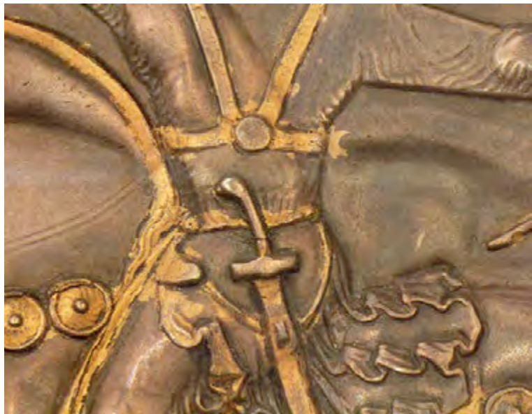
Ил. 3. Рукоять меча Шапура II на блюде из Турушевой (по: Тревер К. В., Луконин В. Г. Сасанидское серебро. Собрание Государственного Эрмитажа. Художественная культура Ирана III–VIII веков. М., 1987. Табл. 8)