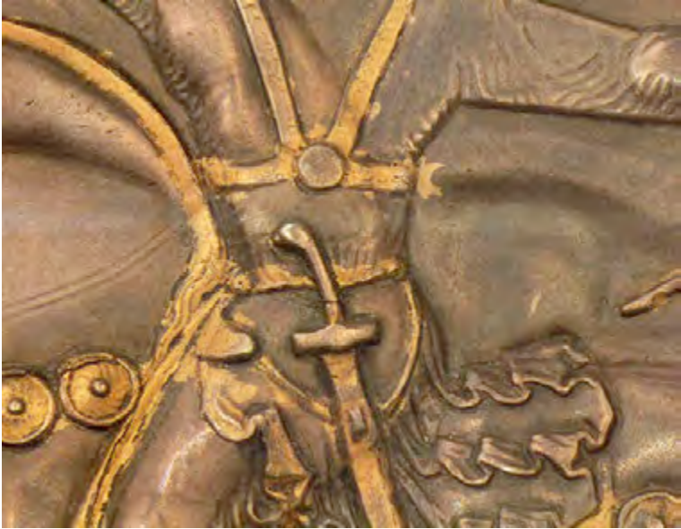
Ил. 3. Рукоять меча Шапура II на блюде из Турушевой (по: Trever K. B., Lukonin V. G. Сасанидское серебро. Собрание Государственного Эрмитажа. Художественная культура Ирана III–VIII веков. М., 1987. Табл. 8)

Fig. 3. The handle of Shapur II's sword on a plate from Turusheva (after: Trever K. V., Lukonin V. G. Sasanidskoe srebro. Sobranie Gosudarstvennogo Ermitazha. Khudozhestvennaia kul'tura Irana III–VIII vekov [Sasanian Silver. Collection of the State Hermitage Museum. The Artistic Culture of Iran of the Third-Eighth Centuries]. Moscow, 1987. Table 8)