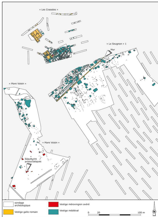
Fig. 2. Secteur domestique et funéraire du village médiéval.

en trente ans. Par ailleurs, le mobilier mérovingien et tardo-antique décrit, considéré comme résiduel, est trop récurrent pour ne pas appartenir à une occupation en tant que telle, qui reste à définir (Béague-Tahon, 1993a, p. 19 et 22). À cet égard, une fouille préventive plus récente, située à « Mare Voisin », contient deux cabanes isolées et deux fours, dont le mobilier le plus tardif appartient au VII e siècle (fig. 2) (Truc, 2009, p. 150-179).