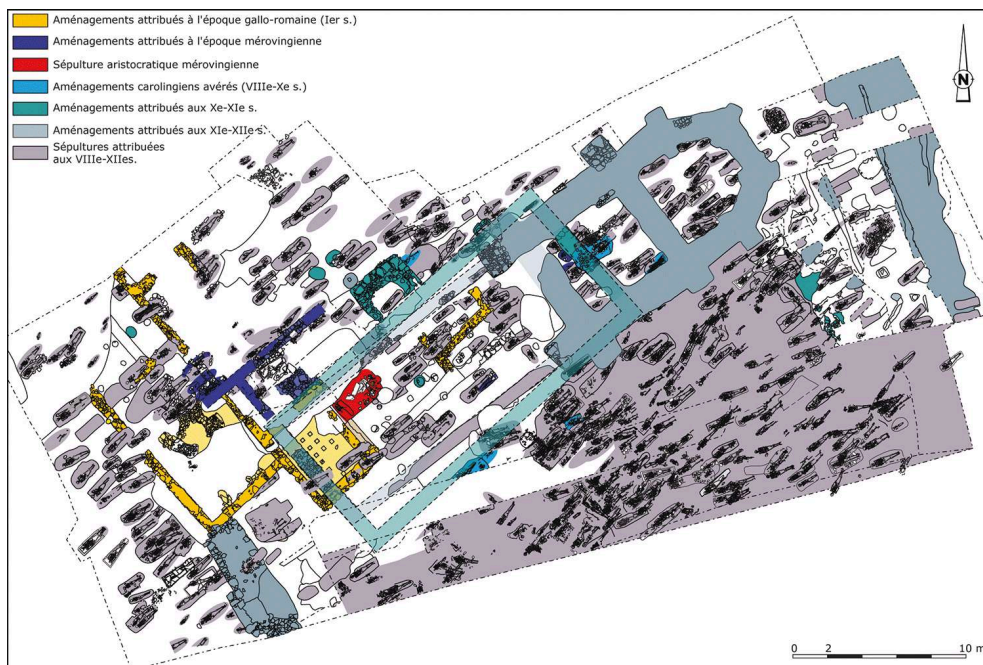
Fig. 3. Plan du secteur du cimetière au terme de la campagne de 2018 (© R. Durost, S. Desbrosse-Degobertière).