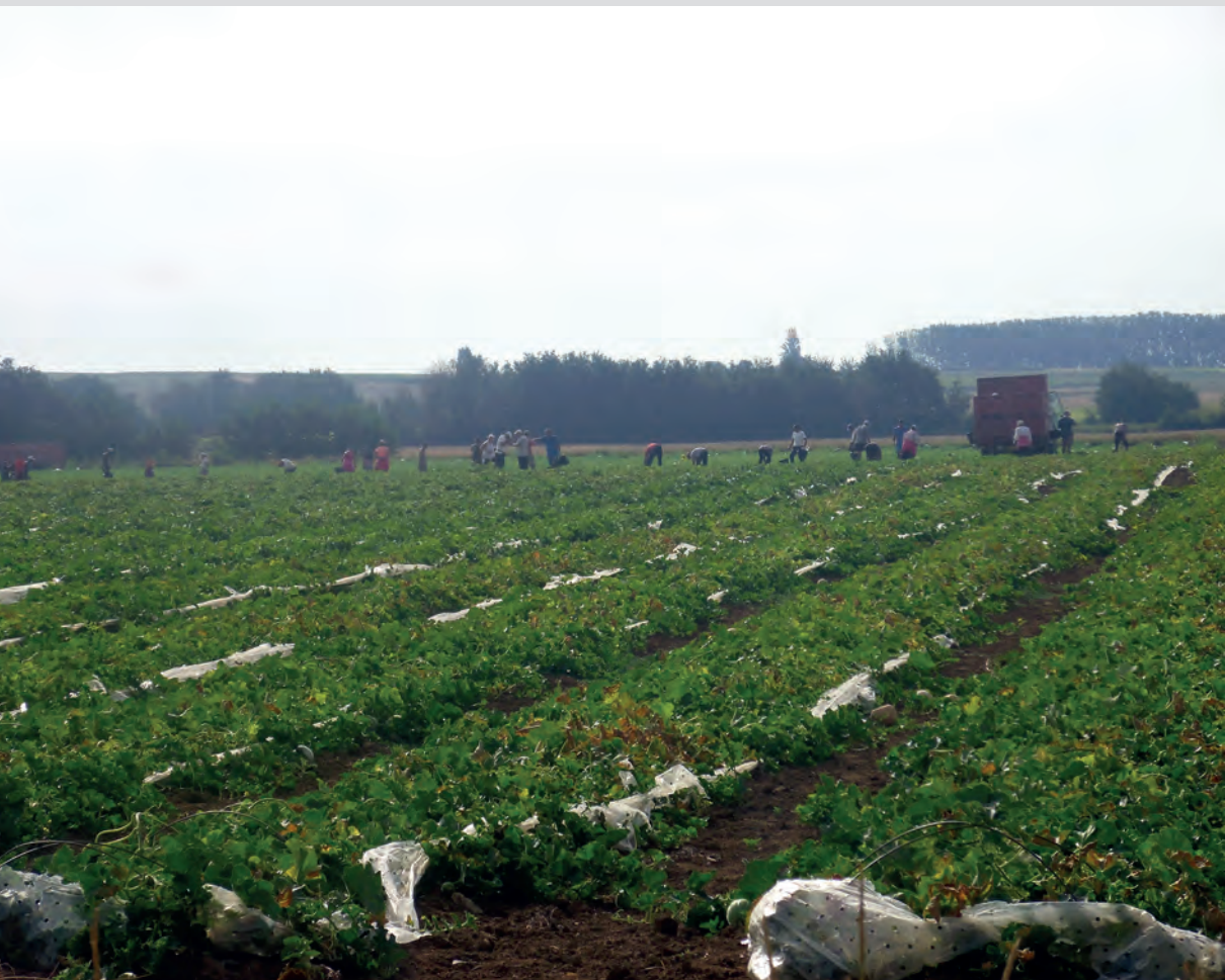
Cueillette de melons par des travailleurs saisonniers, août 2019, Pays loudunais.