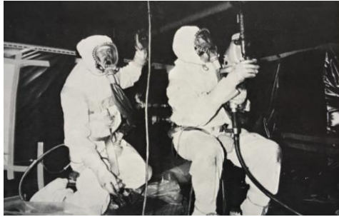
Figure 1 : Travaux au cœur du réacteur accidenté, ATEN, 1970

Après plusieurs mois de travaux, le réacteur est recouplé au réseau électrique le 16 octobre 1970. Il n'est pas nettoyé intégralement et des filtres ont été disposés pour récupérer les débris restants après le redémarrage.