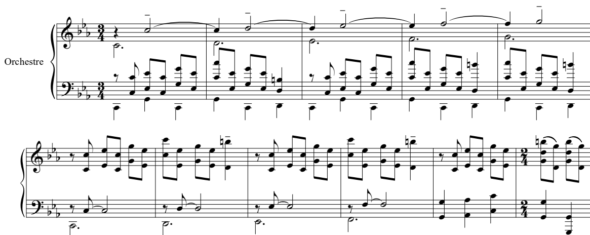
Exemple musical 8 : Patrick DOYLE, Mary Shelley's Frankenstein , 6M1 « The Creation », mes. 40-50

Les mélodies sont fragmentaires et prennent des directions tous azimuts accompagnant ainsi les précipitations de Frankenstein dans son laboratoire qui se jette dans tous les sens après ses appareils. Cette sensation d'effolement se trouve renforcée par des traits rapides de ponctuation dans l'aigu et par un jeu de contrepoint énonçant une même phrase musicale avec un décalage (d'abord d'un soupir puis d'un demi-soupir, et échange de la phrase entre les registres) comme si Frankenstein ne parvenait pas à agir assez rapidement :