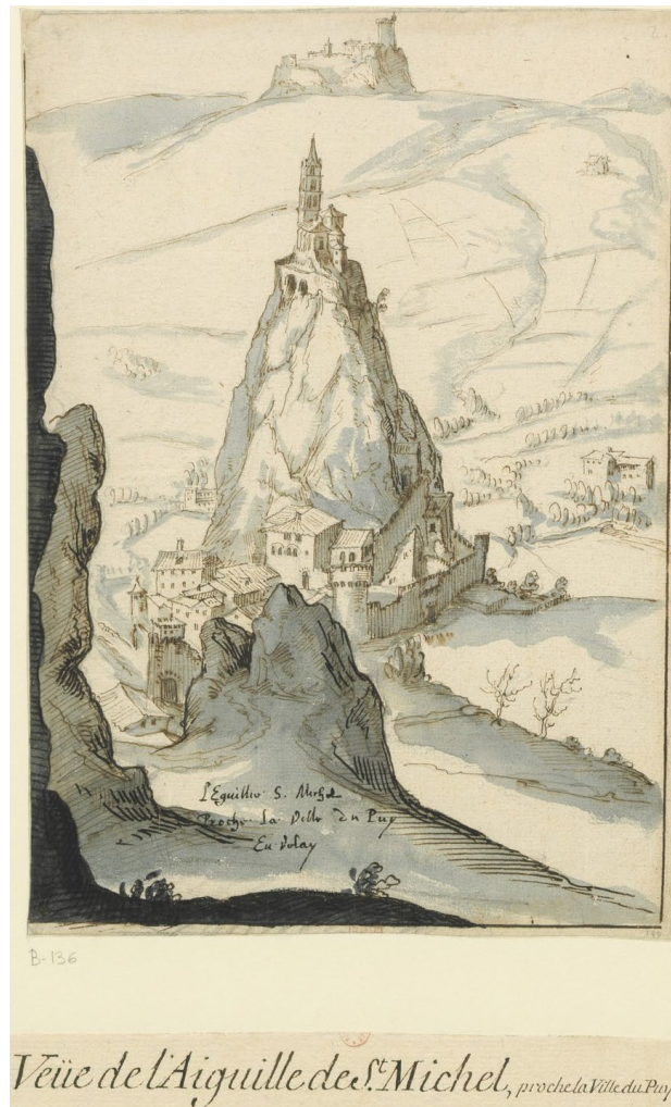
Saint-Michel d'Aiguilhe, Chapelle du X e siècle, Le Puy-en-Velay, Dessin de l'architecte E. MARTELLANGE, 1611. La plus ancienne représentation connue de cette chapelle.

Le Dies Irae et différents hommages à Celle que les litanies appellent aussi Speculum Justiciae , le Miroir de Justice, se trouvent ici mis en abyme, textes et musiques se font écho et se réfléchissent les uns aux autres de manière fractale, comme si l'on était au cœur de ce miroir, jusqu'au vertige. Vertige qu'il est bien naturel d'éprouver au sommet du Rocher Saint-Michel d'Aiguilhe ici évoqué, dont le programme iconographique est aussi celui du Jugement Dernier.