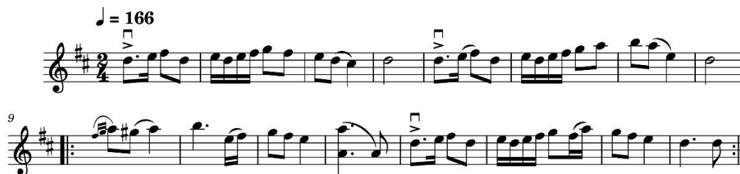
Exemple musical 9 : Ozwozna do zbjórnickiego [« Ozwozna pour le zbjórnicki »]. « Tońcyli zbjórnicy w Mikulášy » [Les bandits dansaient à Liptovský Mikuláš]. Transcription de Krzysztof TREBUNIA TUTKA.

(lentes) pour accompagner la première partie et les mélodies zzielona 83 (verte) pour accompagner les pas des danseurs disposés en ligne à la fin de chaque cycle appartiennent au répertoire de la danse góralski .