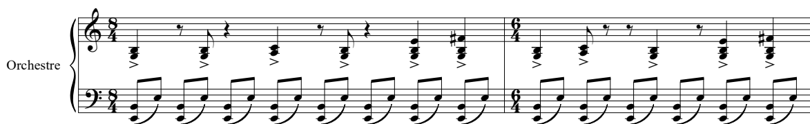
Exemple musical 7 : Patrick DOYLE, Mary Shelley's Frankenstein , 6M1 « The Creation », mes. 19-20

battements par minutes, les métriques inconstantes (sur les quatre-vingt-trois mesures du cue , il y a trente-et-un changements, soit presque une métrique pour trois mesures). Le discours est empreint de fulgurance rythmique avec des duolets et de nombreux triolets qui servent parfois à déployer un contre-chant bavard et pressé. De nombreuses syncopes alimentent cette musique pulsée comme un hoquet du monstre qui prend vie dans une ample métrique à \frac{8}{4} :