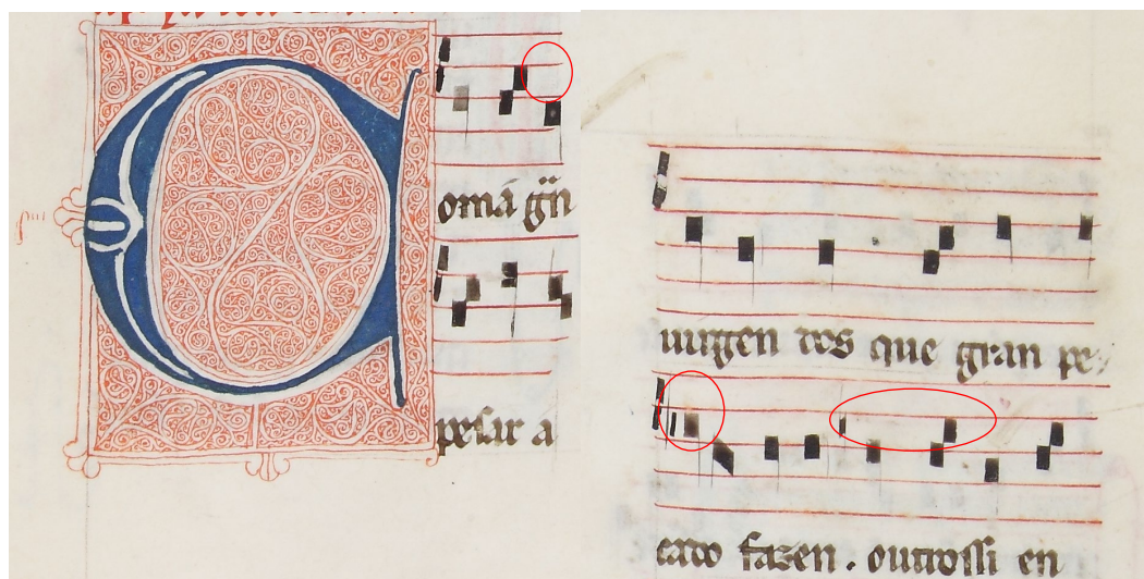
Ms Escorial E, Codex de los Musicos , f° 305r

On pourrait douter de l'analogie suivant la place des demi-tons, souvent mobiles dans cette musique, mais le manuscrit est ici très clair en ce qui concerne la position des si bécarre et bémol, avec un b cuadratus noté dans le manuscrit, ce qui est très rare, et ne permet pas le doute en ce qui concerne leur position.