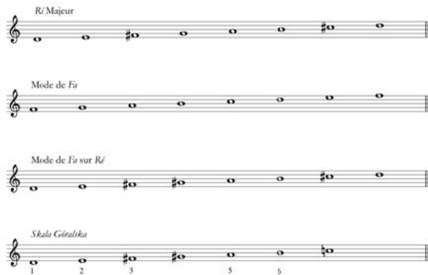
Exemple musical 11 : Explication du mode Skala Góralska également nommé Skala Podhalańska

de la mélodie suivant un mouvement conjoint descendant 89 . Par ailleurs, son accompagnement diffère des autres genres régionaux, puisque le second violon donne des coups d'archet vers le bas pour marquer les temps avec une double corde, puis vers le haut pour marquer les contretemps – mode d'accompagnement qui n'est pas sans rappeler le jeu du bratsch (alto) des Roumains. Comme pour le reste du répertoire de danse, les instruments employés et la répartition de leurs rôles correspondent le plus souvent à ce que Luc CHARLES-DOMINIQUE désigne comme « bande » de violons – ici nommée kapela góralska – composée d'un premier violon ( prym ), d'un second violon ( sekund ) et d'une basse ( basy ) 90 . Notons que les musiciens 91 , ainsi que les œuvres de peinture sur verre conservées dans les collections du Musée des Tatras de Zakopane, présentent la cornemuse comme antérieure au violon dans l'accompagnement de la danse, qui l'aurait remplacée au cours du XX e siècle.