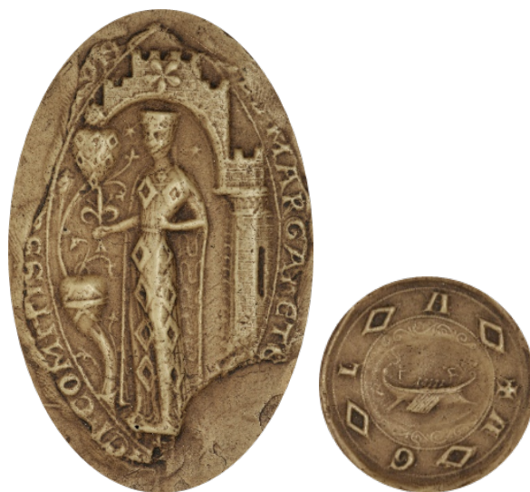
1. Grand sceau et contre-sceau de Marguerite de Beaumont, comtesse de Winchester, utilisés en 1220-1233 (82 mm /51 mm et 33 mm). Moulages, AN, sc/N 56 et 56 bis.

Une récente participation au Congrès annuel du GIS-religions à Lyon 1 m'a amenée à formuler une nouvelle hypothèse au sujet d'un sceau recensé et étudié dans plusieurs articles 2 . Il s'agit d'une empreinte de 1233 imprimée au dos du grand sceau de la comtesse de Winchester, Marguerite de Beaumont, alors veuve de Saer IV de Quincy ( fig. 1 ). Utilisé déjà vers 1220, cet harmonieux grand sceau a retenu l'attention de plusieurs auteurs tant par sa qualité que par les armoiries et emblèmes qui accompagnent la figure en pied de la sigillante. Le contre-sceau – qui nous intéressera ici –, connu uniquement par l'empreinte de 1233, est tout aussi élégant : la matrice était sertie d'une intaille antique d'une gravure très fine, figurant une trirème.