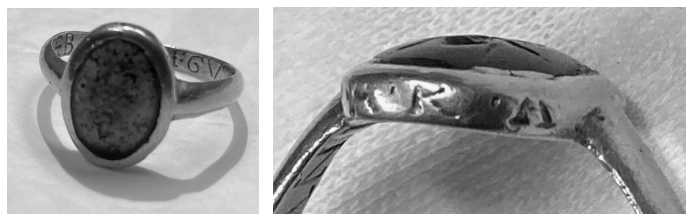
3. Bague sigillaire (or et jaspe vert ?) retrouvée dans la tombe d'Ulger, évêque d'Angers († 1149). L'intaille montre une fourmi. La monture porte les inscriptions magiques BESTARA (chaton) et THEBAL GUT GUTTHANI (anneau). Trésor de la cathédrale d'Angers.

à ✠ THEBAL GUT GUTTHANI (fig. 3) 15 . Ces deux invocations sont bien signalées dans le Dictionnaire des formules magiques , mais séparément 16 . En comparant avec la même formule inscrite sur la bague du British Museum évoquée supra , on remarque les variantes d'orthographe, phénomène très courant pour ces formules transmises oralement ou au moyen d'une calligraphie difficile à déchiffrer 17 .