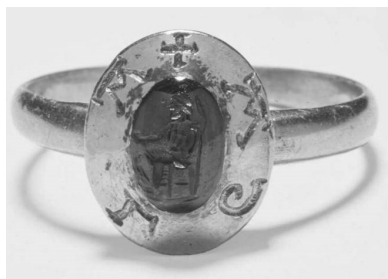
2. Bague sigillaire (or et sardoine), Angleterre, XIII e siècle. L'intaille montre Jupiter assis de profil. Légende : ✠ AGLA. Cliché inversé. BM, 1932, 0209,1.

Marguerite peu après qu'ils eurent acquis des mains de Jean sans Terre le comté de Winchester en 1207 3 . Quant aux lettres, il s'agit de l'acronyme d'une prière juive : Atah Gabor Leolam Adonai (« Tu règnes pour l'éternité, Seigneur »). Cet acronyme est l'une des nombreuses dénominations de Dieu. Ce sens était compris de certains, comme l'a montré Martin Henig en évoquant le cas d'une bague sigillaire en or sertie d'une sardoine gravée d'un Jupiter trônant (fig. 2) : la légende ✠ AGLA indique clairement que Jupiter était assimilé à Dieu le Père 4 .