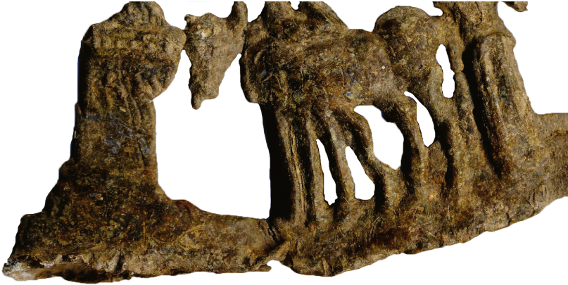
Fig. 3. Graffites sur le groupe statuaire. Face A.