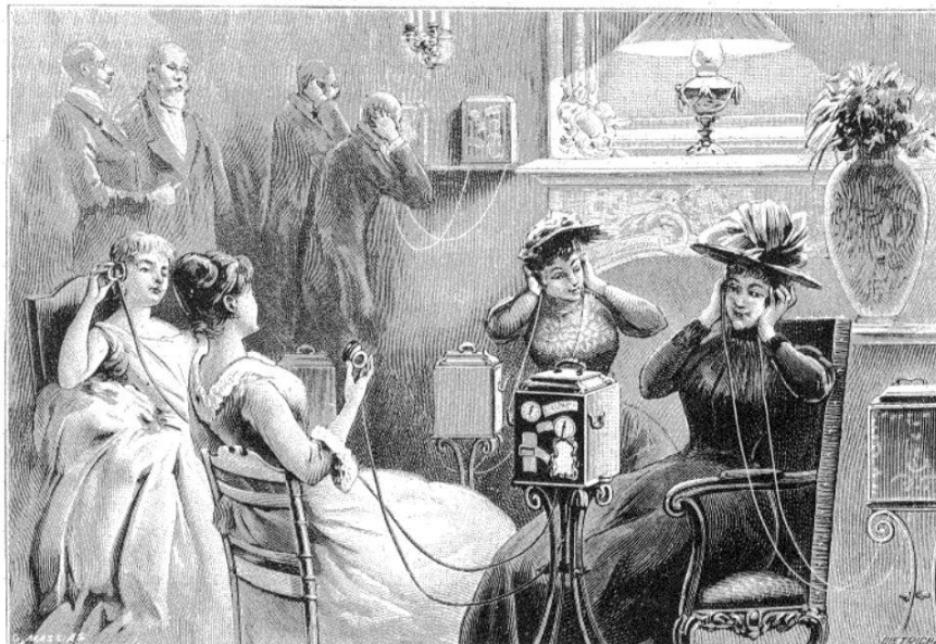
Figure 3 – « Audition du théâtrophone dans le salon d'un grand hôtel de Paris. – Aspect extérieur de l'appareil » ( La Nature , deuxième semestre 1892, p. 56).