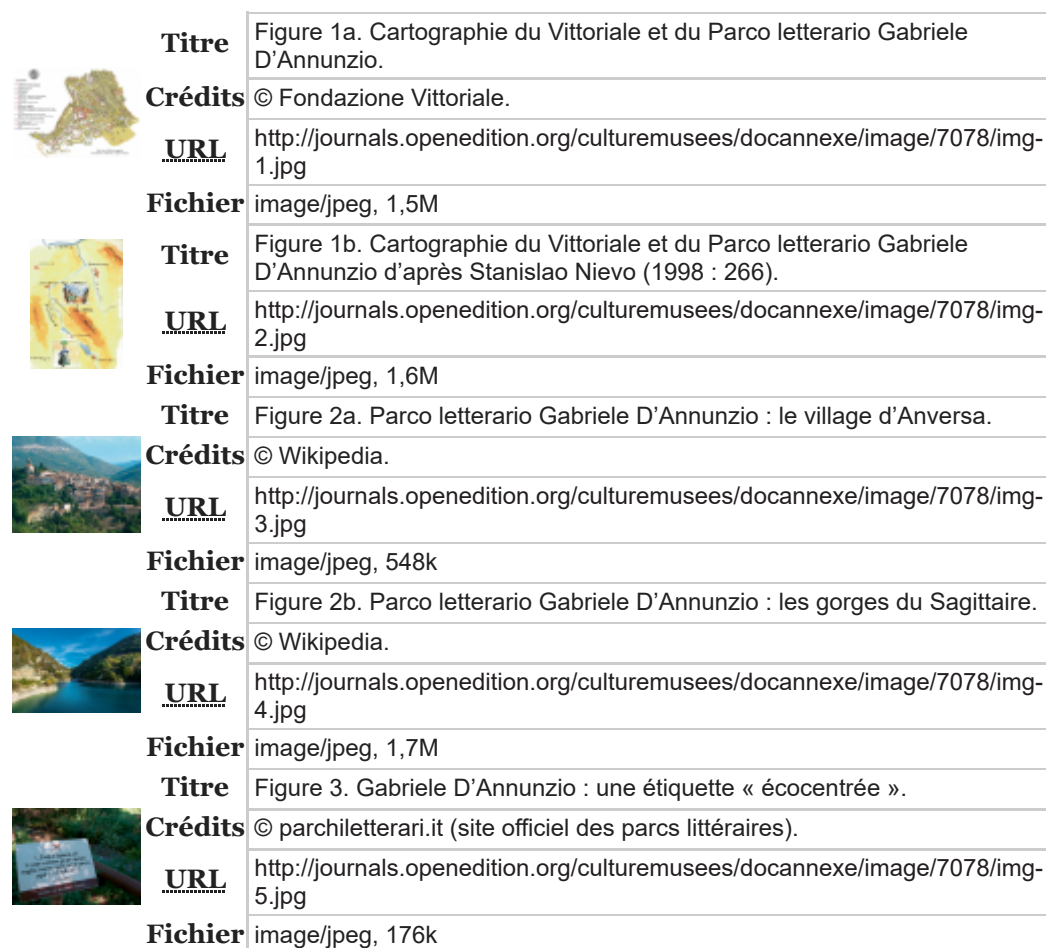
Table des illustrations

10 L'inauguration, en septembre 2019, d'une statue de D'Annunzio dans la municipalité de Trieste a déclenché un mouvement d'indignation en Croatie (D'Annunzio ayant défendu l'italianité de Fiume, l'actuelle Rijeka croate). La municipalité de Pescara a rapidement proposé de solder cette querelle mémorielle en récupérant la statue (Tonet & Nasi, 2019).