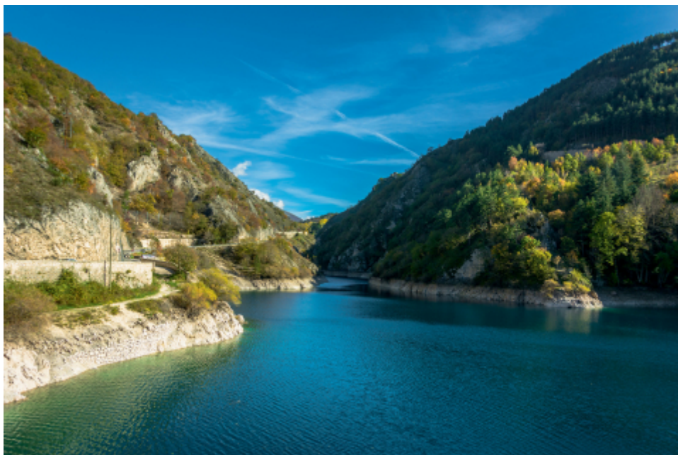
Figure 2b. Parco letterario Gabriele D'Annunzio : les gorges du Sagittaire.