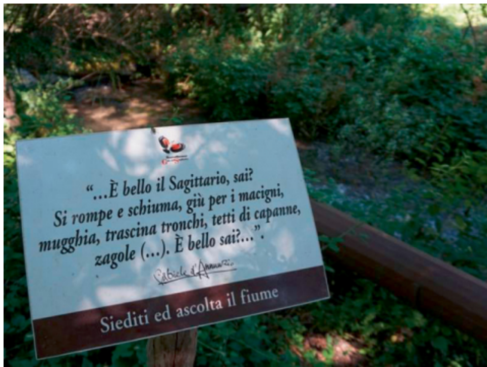
Figure 3. Gabriele D'Annunzio : une étiquette « écocentrée ».