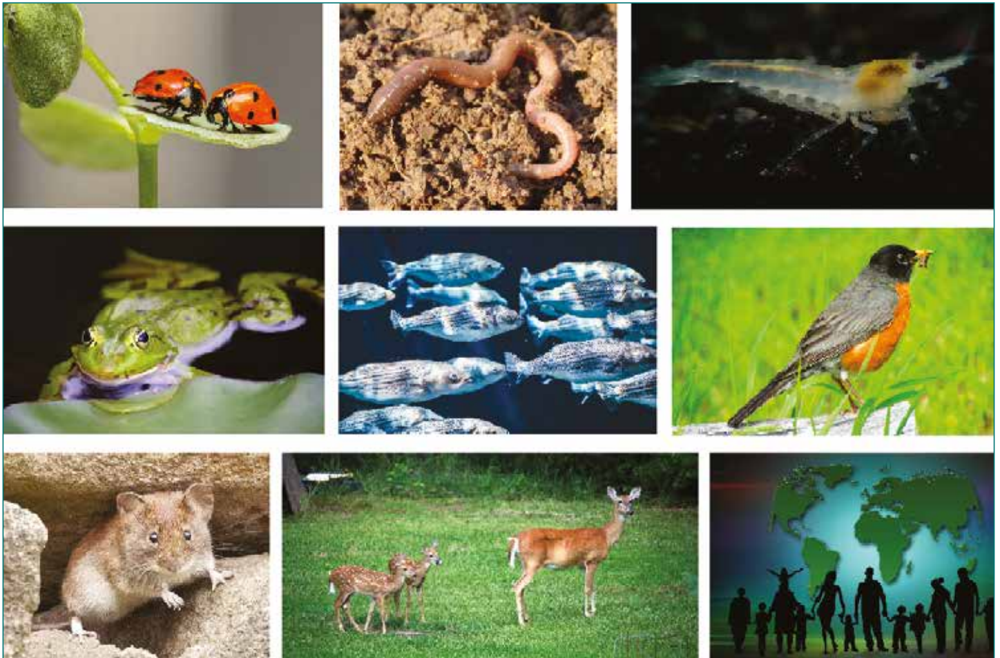
Figure 4 : Exemples de groupes taxonomiques parmi les plus impactés par les néonicotinoïdes. Invertébrés terrestres et aquatiques : insectes, vers de terre et crustacés. Vertébrés : amphibiens, poissons et oiseaux. Mammifères : rongeurs, cervidés et humains.

ment 2 à 20 % des néonicotinoïdes pénètrent la plante traitée, tout le reste contamine les sols et impacte les invertébrés du sol comme les vers de terre (5). La contamination généralisée des eaux de surface découle de celle des sols et de la solubilité des néonicotinoïdes. Ils sont transportés par lixiviation ou lessivage. Les fortes valeurs atteintes dans les eaux de surface impactent alors les écosystèmes aquatiques et sédimentaires. Même les eaux profondes sont déjà significativement polluées.