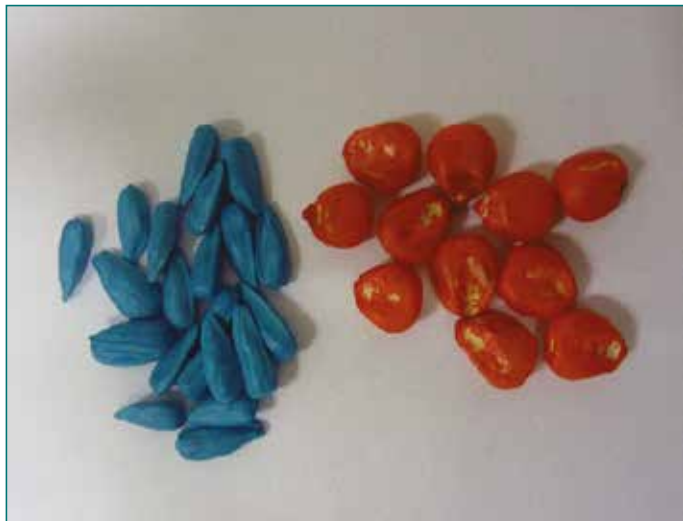
Fig. 2 : Semences enrobées d'insecticide avant semis (bleu : tournesol, rouge : maïs).

Comme ces insecticides ont une extrême toxicité, ils peuvent être employés pour asperger les cultures (pulvérisation) mais également pour enrober les semences, ce qui est plus discret et pratique (Fig. 2). Dans ce dernier cas, les semences sont préalablement pelliculées d'insecticide, avant le semis. Cette technique d'enrobage de semence permet généralement de diviser la quantité d'insecticide utilisée à l'hectare par un facteur cinq par