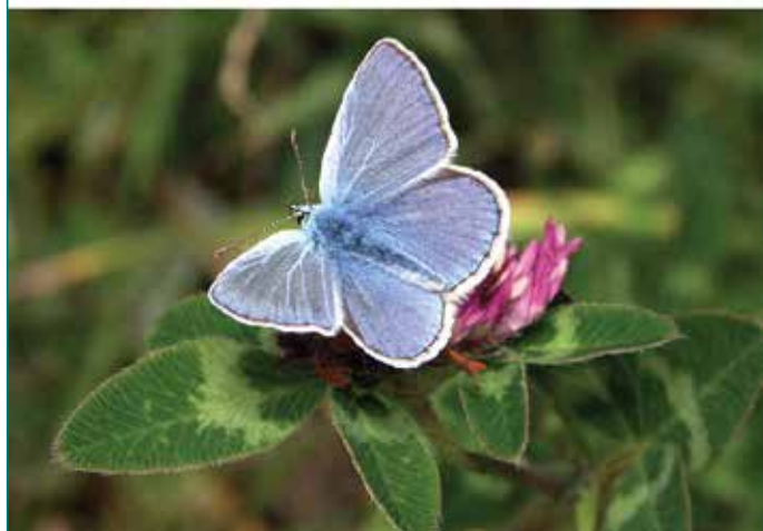
Figure 3 : En haut : abeille récoltant du pollen sur maïs © J.-M. Bonmatin. En bas : papillon butineur © H. Mouret ( Arthropologia ).

disciplines, d'une vingtaine de pays, tous volontaires et indépendants, sans conflit d'intérêt. Leur évaluation mondiale intégrée est publiée en 2014 sous la forme d'une