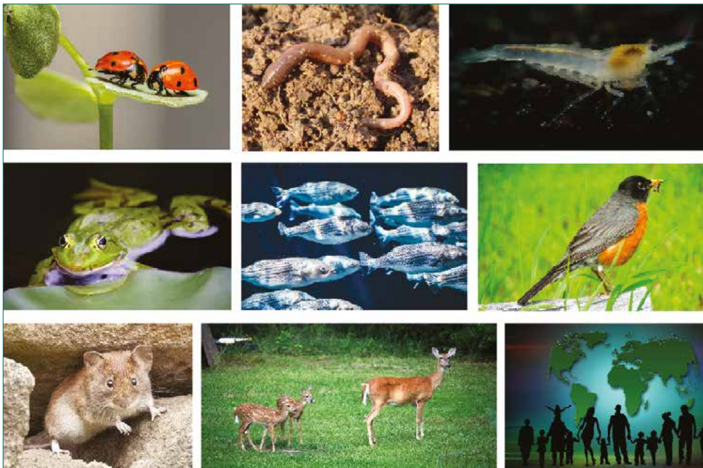
Figure 4 : Exemples de groupes taxonomiques parmi les plus impactés par les néonicotinoïdes. Invertébrés terrestres et aquatiques : insectes, vers de terre et crustacés. Vertébrés : amphibiens, poissons et oiseaux. Mammifères : rongeurs, cervidés et humains.

ment 2 à 20 % des néonicotinoïdes pénètrent la plante traitée, tout le reste contamine les sols et impacte les invertébrés du sol comme les vers de terre (5). La contamination généralisée des eaux de surface découle de celle des sols et de la solubilité des néonicotinoïdes. Ils sont transportés par lixiviation ou lessivage. Les fortes valeurs atteintes dans les eaux de surface impactent alors les écosystèmes aquatiques et sédimentaires. Même les eaux profondes sont déjà significativement polluées.