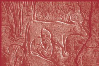
Oued Tiksafin, Messak Settafet (Fezzân, Libye). Scène de traite, détail

Source : d'après J.-D. Lajoux 1977 ; voir Chaker (fig. 5) dans ce volume