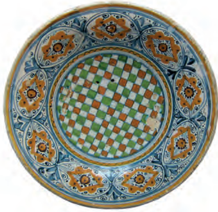
Village de l'Ortolo, coupe originaire de Florence, fin XV e siècle

L'abondant mobilier mis au jour témoigne du quotidien d'une petite société rurale, encadrée par des familles de principali , officiers de pièves et guerriers à cheval rivalisant de prestige avec les Cinarchesi. Mais les fouilles ont montré que ce village ne naît pas avant le milieu du XIV e siècle, pour disparaître dans les années 1510-1520. Il évolue donc dans un cadre chronologique à peu près similaire à celui de Baricci.