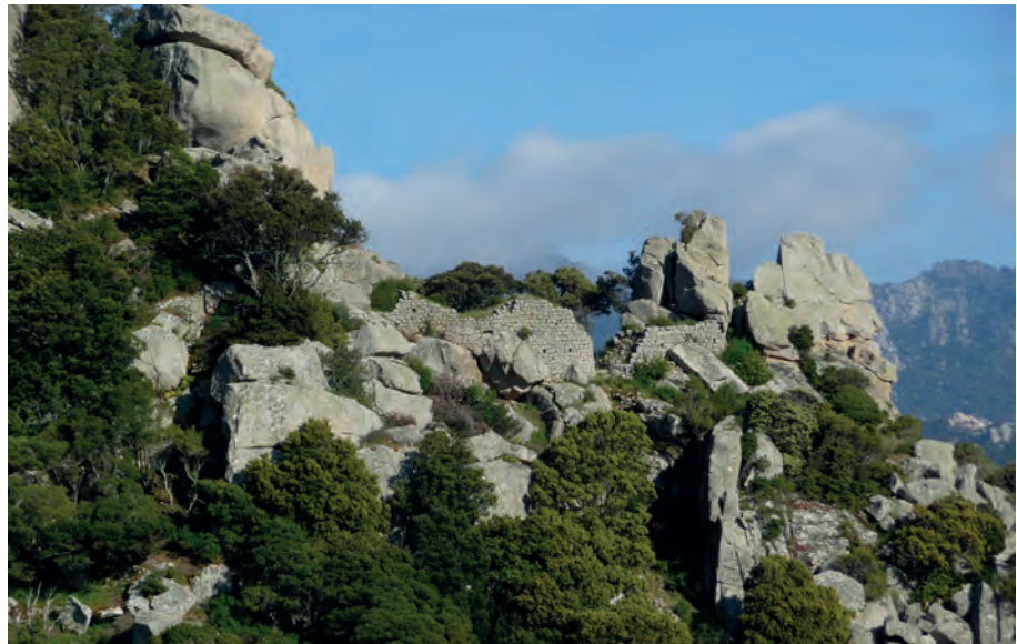
Sartène, Baricci, logis seigneurial

Ce site fortifié oublié, que l'on peut identifier au castrum de Litala dans les sources écrites des XIII e et XIV e siècles, fut, avant Baricci, au cœur d'un territoire seigneurial d'abord limité aux pièves de Sartène et Bisughjè avant de s'étendre dans les années 1320-1330 à la Corse méridionale, pour finalement disparaître sous les coups de puissants rivaux au début du XV e siècle. Ce site complexe, très différent du piton de Baricci, se caractérise par un vaste espace sommital serti entre deux rochers fortifiés et une muraille barrant le flanc le plus vulnérable. Des habitats sont repérables sur les pentes ouest et sud du massif, au milieu des chaos rocheux et des taffoni. Le périmètre sommital a fait l'objet en 2016 d'une première opération archéologique qui a livré des niveaux d'occupation du XIV e siècle... La poursuite des recherches à Litala, en confrontation avec les deux autres sites, pourrait permettre de mieux cerner l'évolution de l'habitat, du castrum au village de pente, dans le Sartenais à l'époque médiévale.