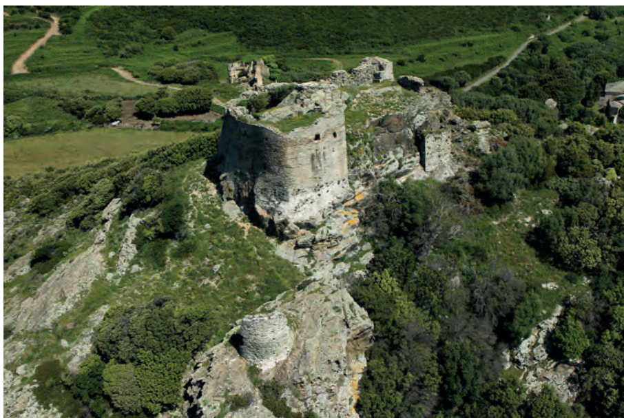
Rogliano, Castellu de San Colombanu