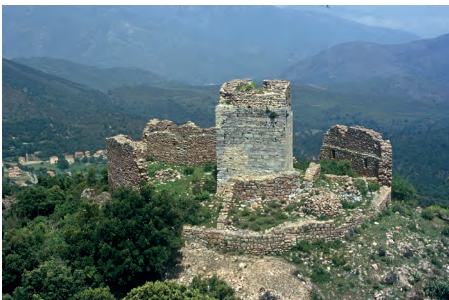
Prato-di-Giovellina, Castellu de Serravale