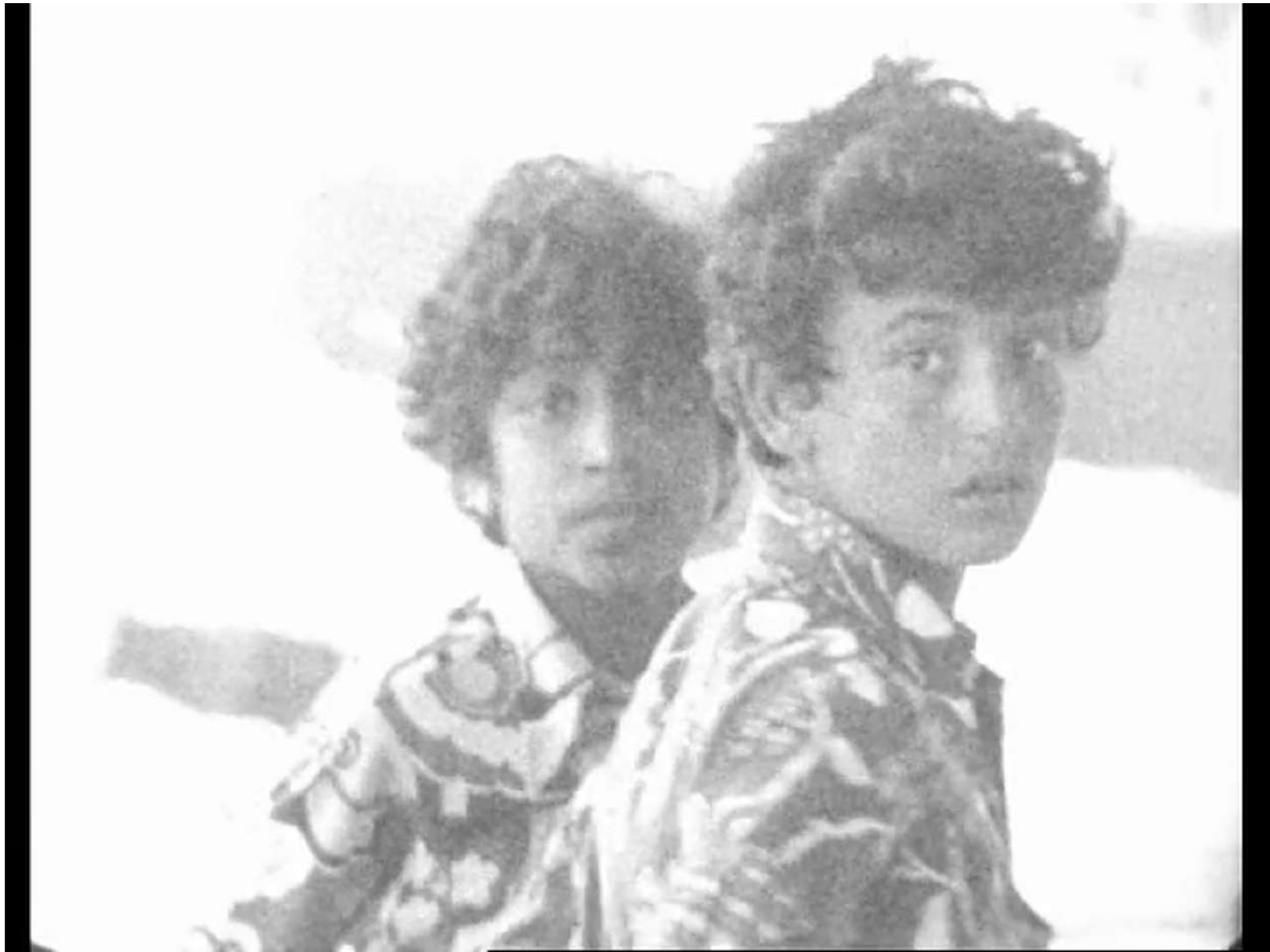
Tal al Zaatar – Rush non utilisé