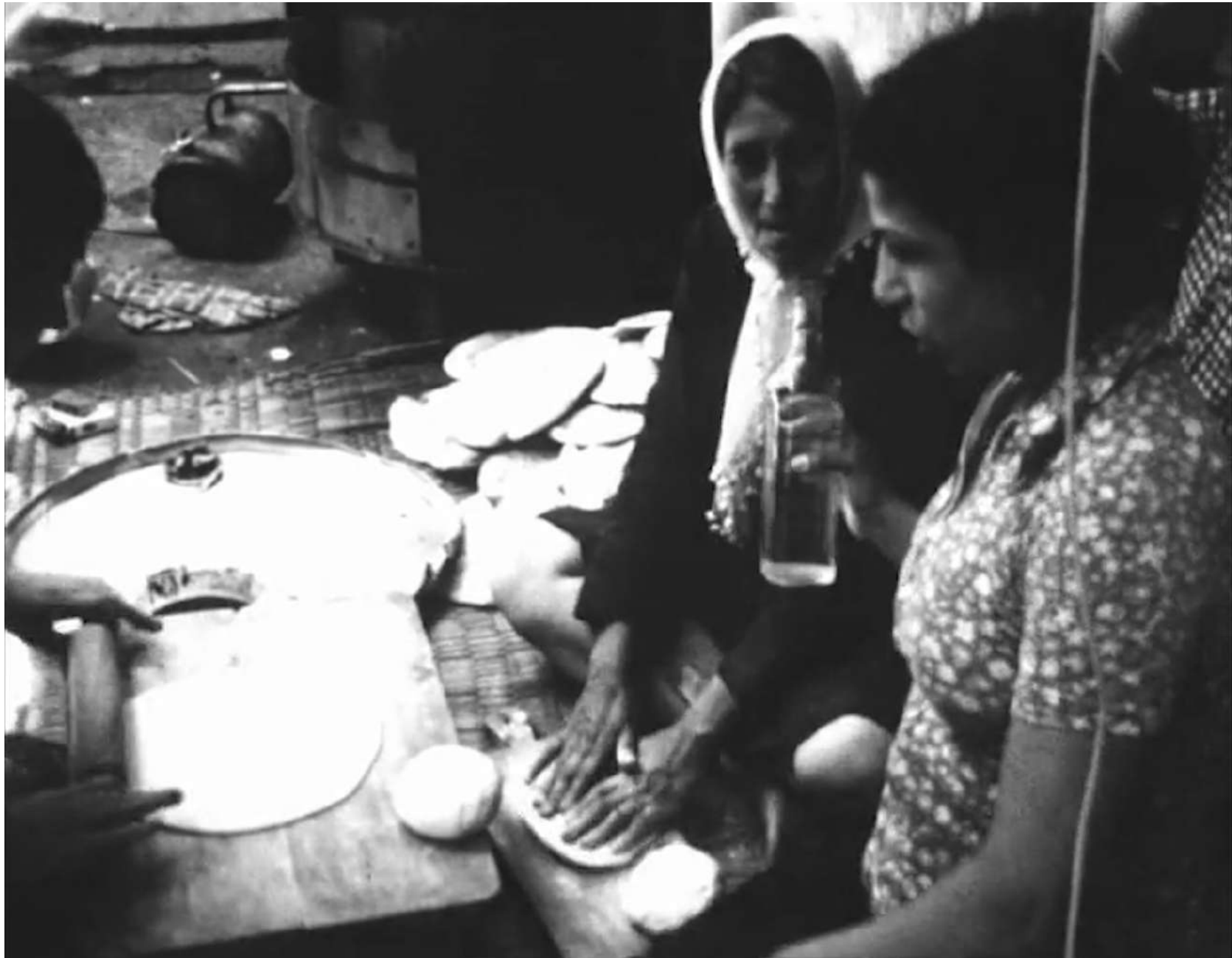
Tal al Zaatar – Rush non utilisé