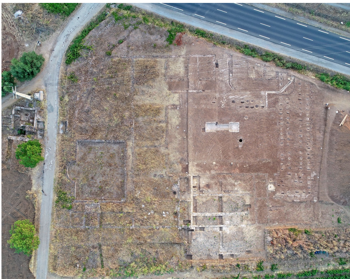
Fig. 4 : Photographie aérienne de la villa de Saint-Bézard (Aspiran, Hérault). Cl. V. Lauras/Globedrone ; LabEx Archimède/CNRS del. 2020.

de ses prédécesseurs du I er s. av. J.-C., investissant dans la province afin d'y faire fructifier ses affaires (Mauné, Carrato 2012). La villa , dégagée intégralement grâce à une fouille programmée de longue haleine (2006-2013 et 2019-2021), est constituée d'un bloc bâti rectangulaire de 49 x 51 m comportant une grande cour à péristyle et une façade à colonnade dominant de plusieurs mètres la rivière Dourbie (fig. 4). Les deux ailes latérales permettaient le stockage de 4000 à 4500 hl de vin. Les espaces résidentiels sont restitués dans les étages se trouvant au-dessus de l'aile méridionale abritant les fouloirs et les pressoirs, face au porche d'entrée axial. Ils dominaient la cour et disposaient d'une vue plongeante sur la rivière Dourbie et la voie Cessero-Luteva-Condatomagos , distante de 500 m. Dans les années 30 ap. J.-C., une aile thermale avec palestres et peut-être une première fontaine située dans la cour centrale ont été ajoutées à cet ensemble, accentuant sa monumentalisation qui culminera en 70/71 ap. J.-C. avec la construction d'une natatio de 280 m 2 , installée dans la palestres et alimentée par un aqueduc. La grande fonctionnalité du plan symétrique, la rationalité de l'aménagement des accès expliquent pourquoi, mises à part quelques modifications mineures, la villa a conservé son plan originel pendant trois siècles.