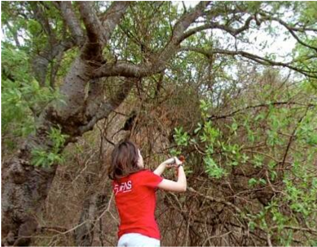
Fig.2 : Échantillonnage de bois moderne pendant une mission de terrain autour du site archéologique.