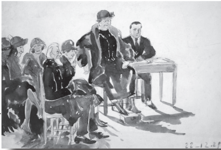
Max Jacob, La Conférence , dessin original, signé à la plume en bas au centre, et daté « 22-12-25 », au pinceau en bas à droite. Encre de Chine, plume et lavis, 29,5 x 21 cm, encadrement sous verre.