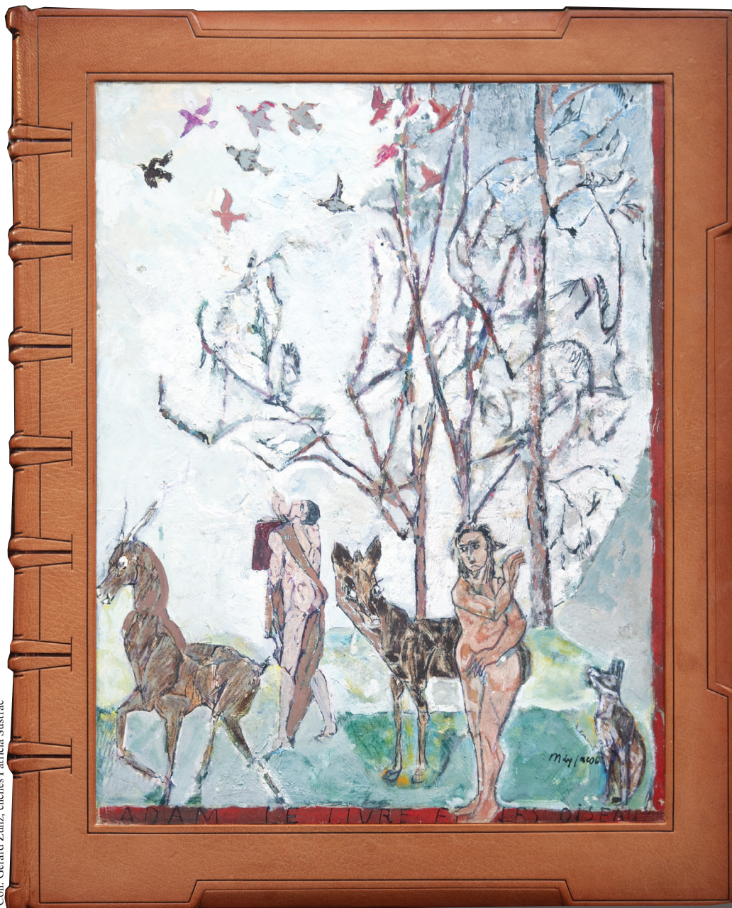
Album breton , gouache (35,5 × 47 cm), insérée au plat supérieur, signée bas dr. de la reliure, titrée en pied de page : « ADAM LE LIVRE ET LES OISEAUX. »

Coll. Gérard Zunz, clichés Patricia Sustrac