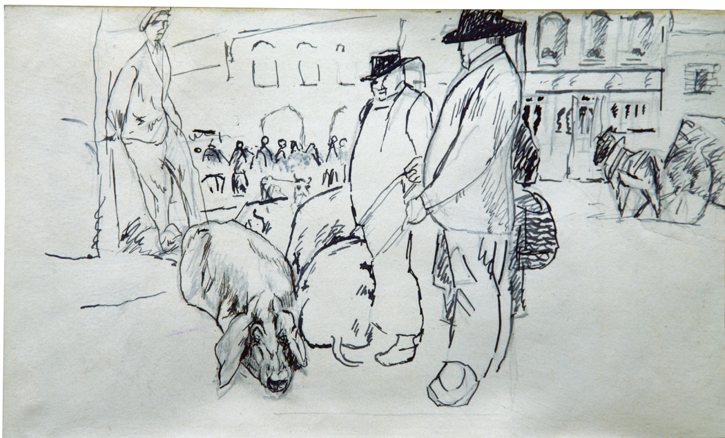
Album breton , « Scène de marché à Quimper », plume et crayon, p. 30.