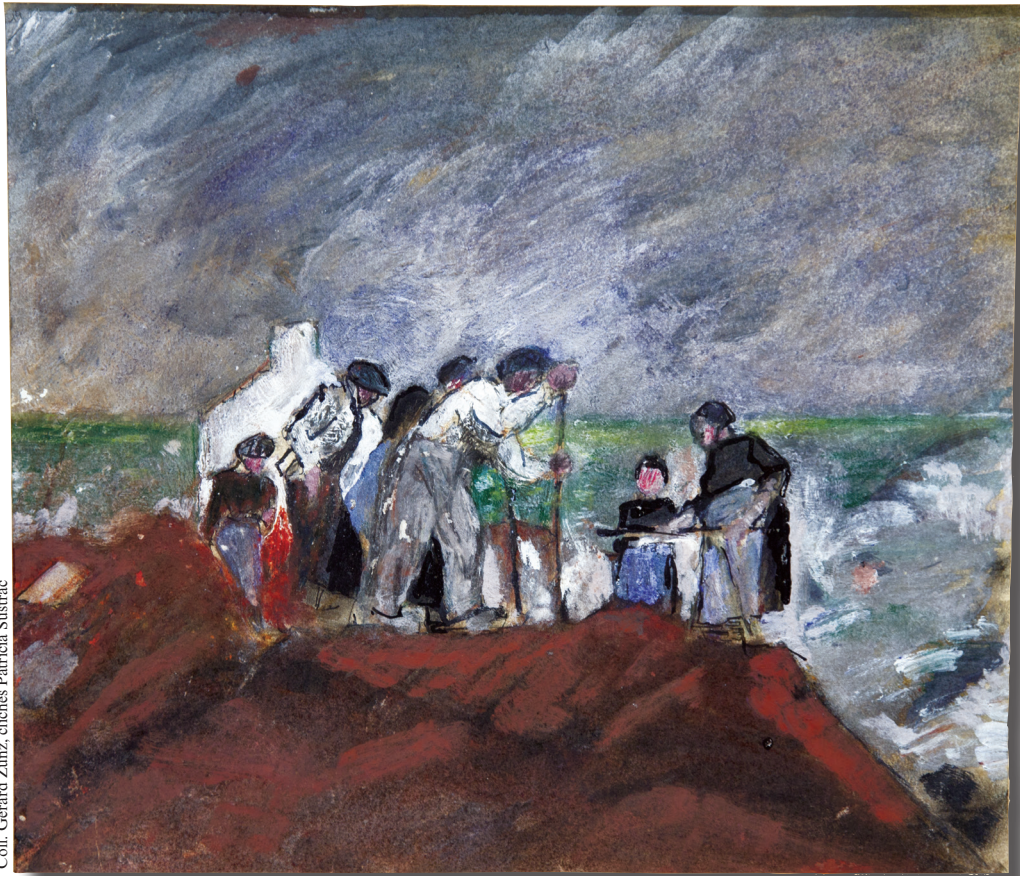
Album breton , « Paysans sur une falaise en bord de la mer », gouache, p. 14.

Coll. Gérard Zumz, clichés Patricia Sustrac