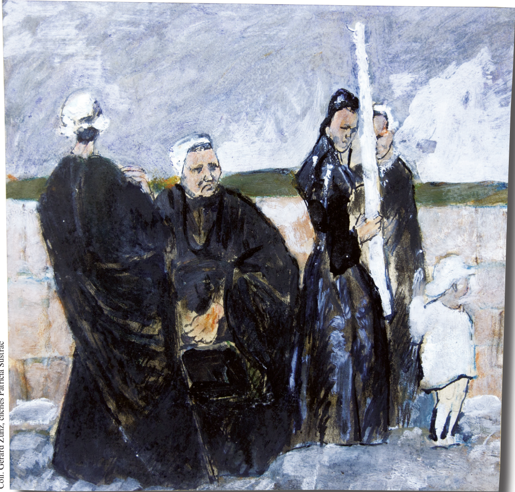
Album breton , « En attente de procession, Pardon de Ste-Anne-la-Palud », gouache, p. 63.

Coll. Gérard Zamz, clichés Patricia Sustrac