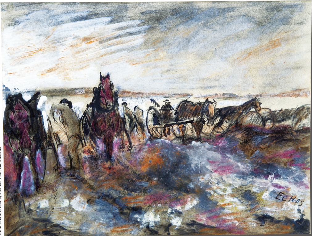
Album breton , « Régence du géomon », mention ms aut., légende bas dr. : « ÉCHOS », p. 16.