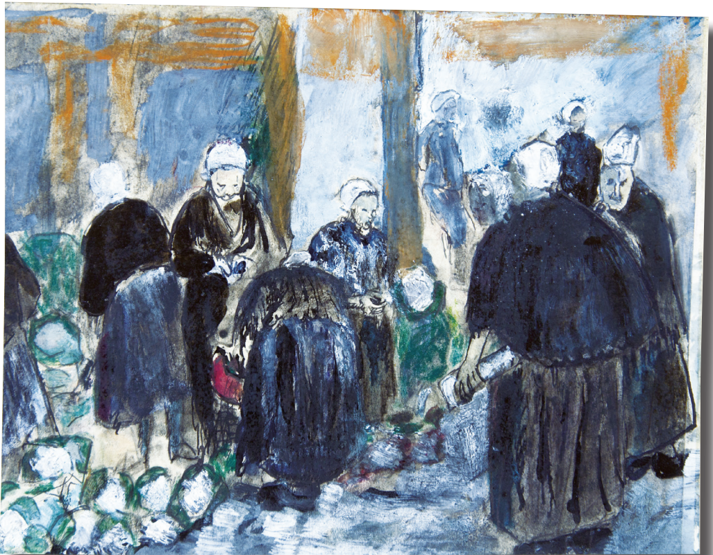
Album breton , « Scène de marché à Quimper », gouache, p. 33.