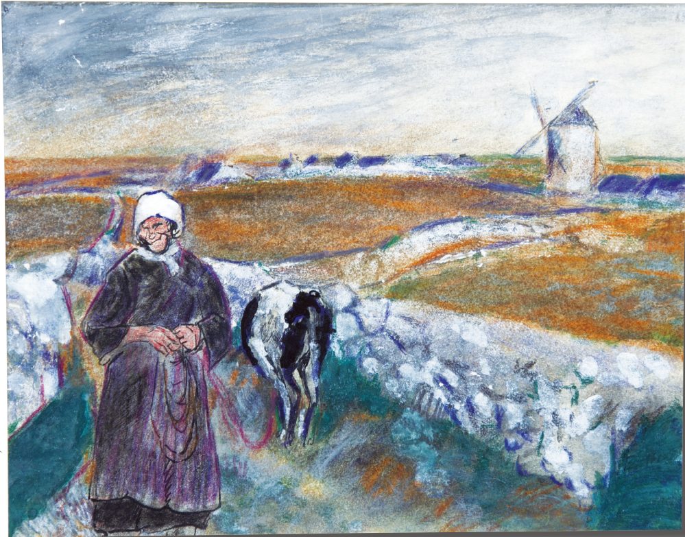
Album breton , « Vachère et sa pie-noire », gouache, p. 24.