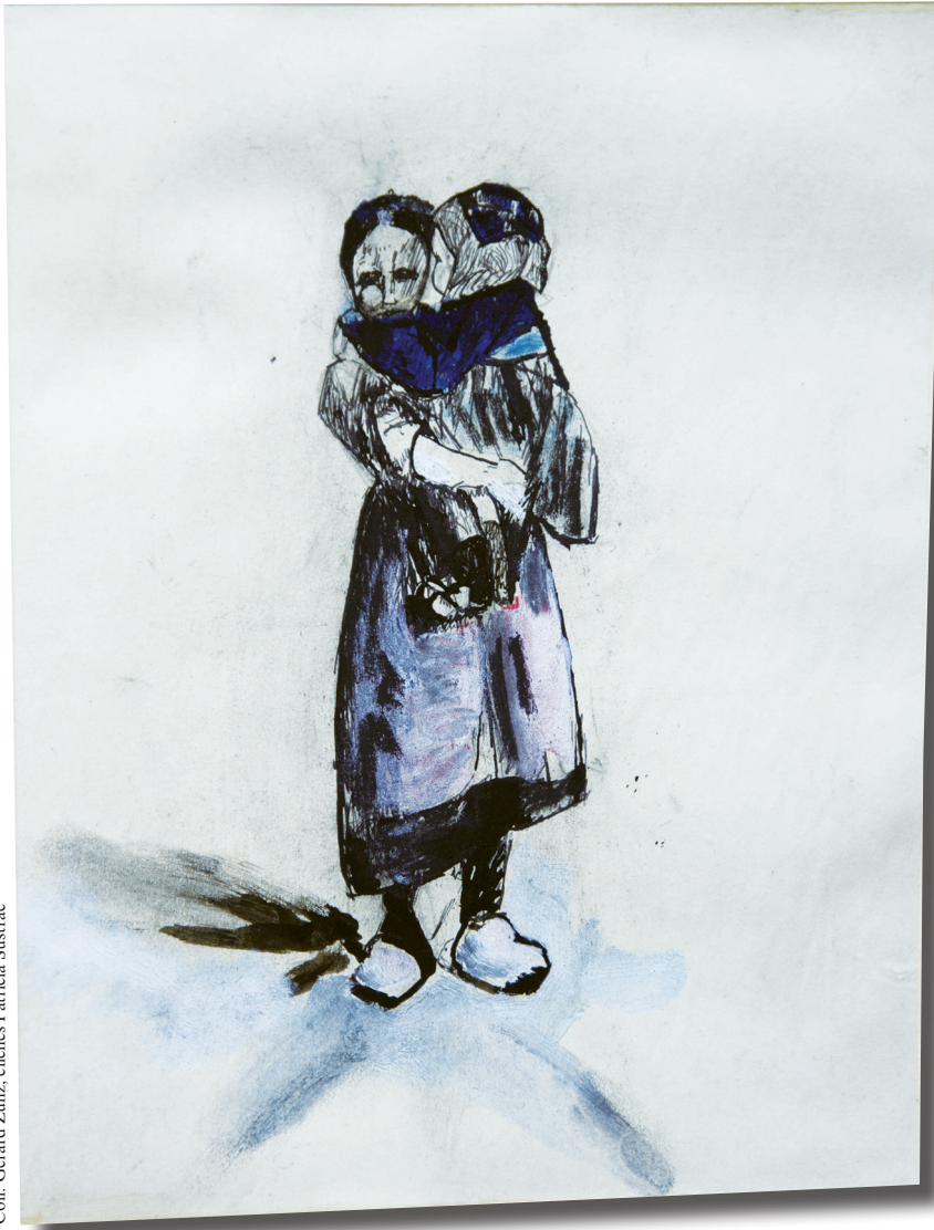
Album breton , « Petite Bretonne portant une fillette », gouache et plume, rehaut de pastel gras bleu et traits de rouge, p. 53.