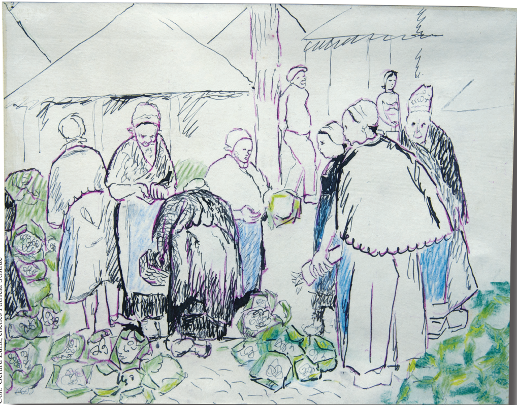
Album breton, étude, p. 34.