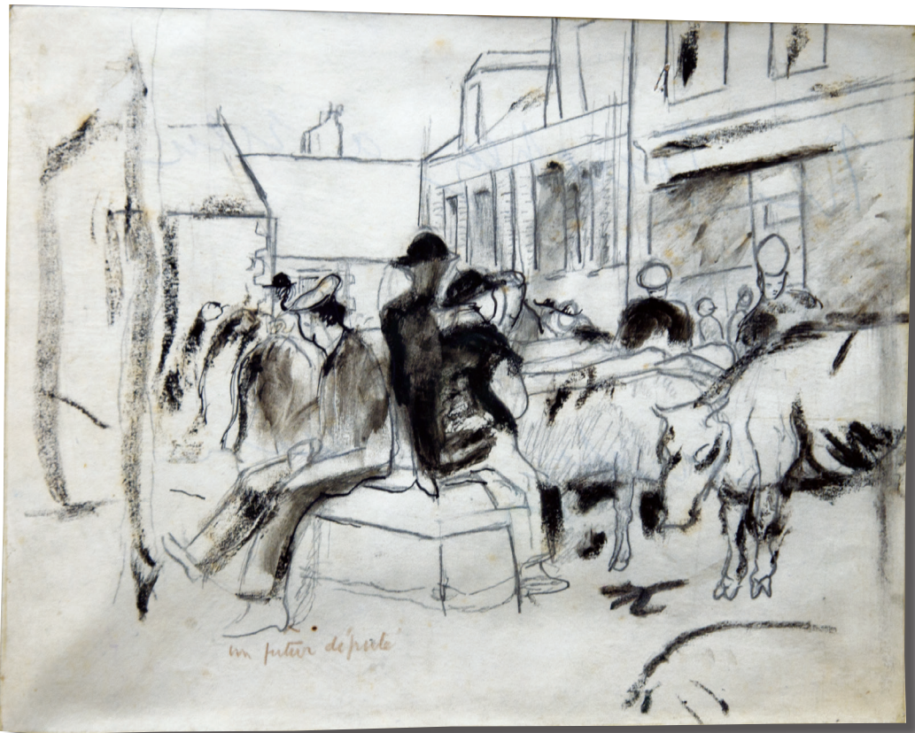
Album breton , « Scène de marché à Quimper, place de La Tourbie », plume et crayon, mention aut. « Un futur député », bas g., p. 29.

Coll. Gérard Zunz, clichés Patricia Suetrac