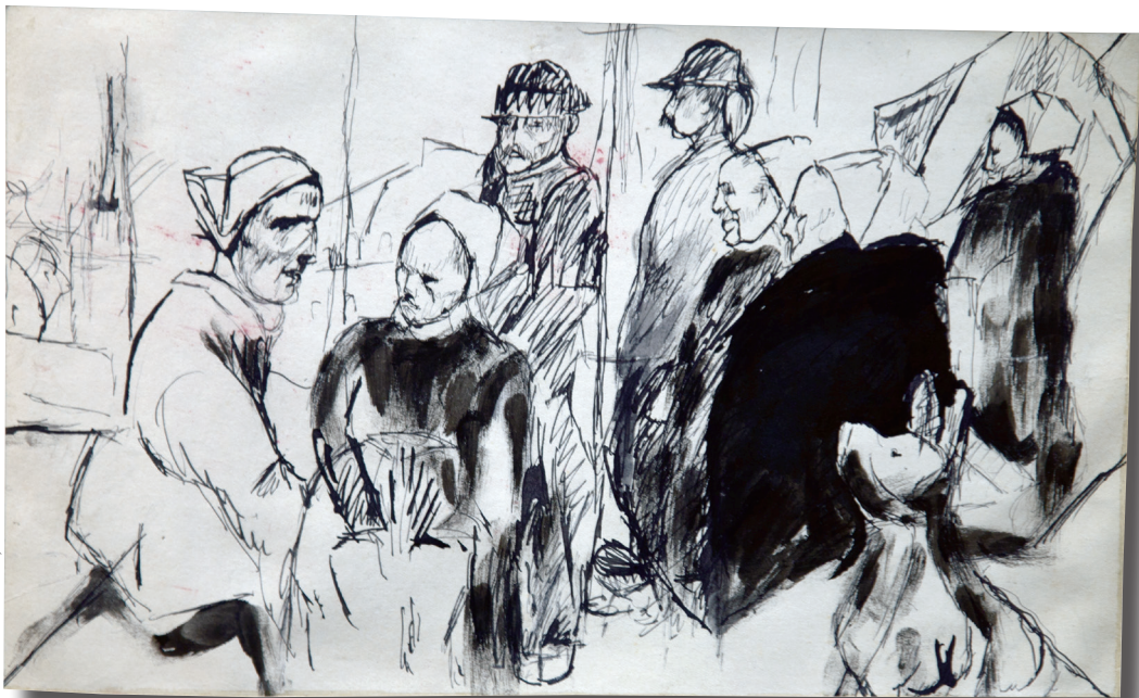
Album breton , « Scène de marché à Quimper », encre, p. 44.

Coll. Gérard Zunz, clichés Patricia Sustrac