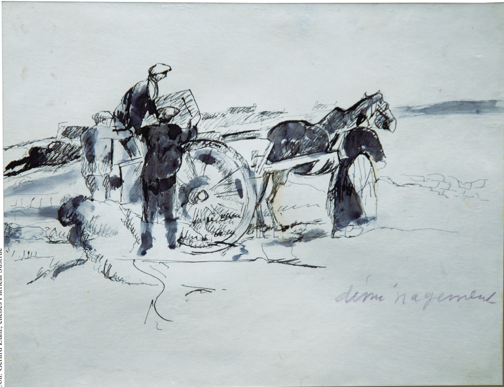
Album breton , « Hommes chargeant une malle sur une charrette », mention légendée au crayon rouge, bas dr. : « Déménagement », p. 22.