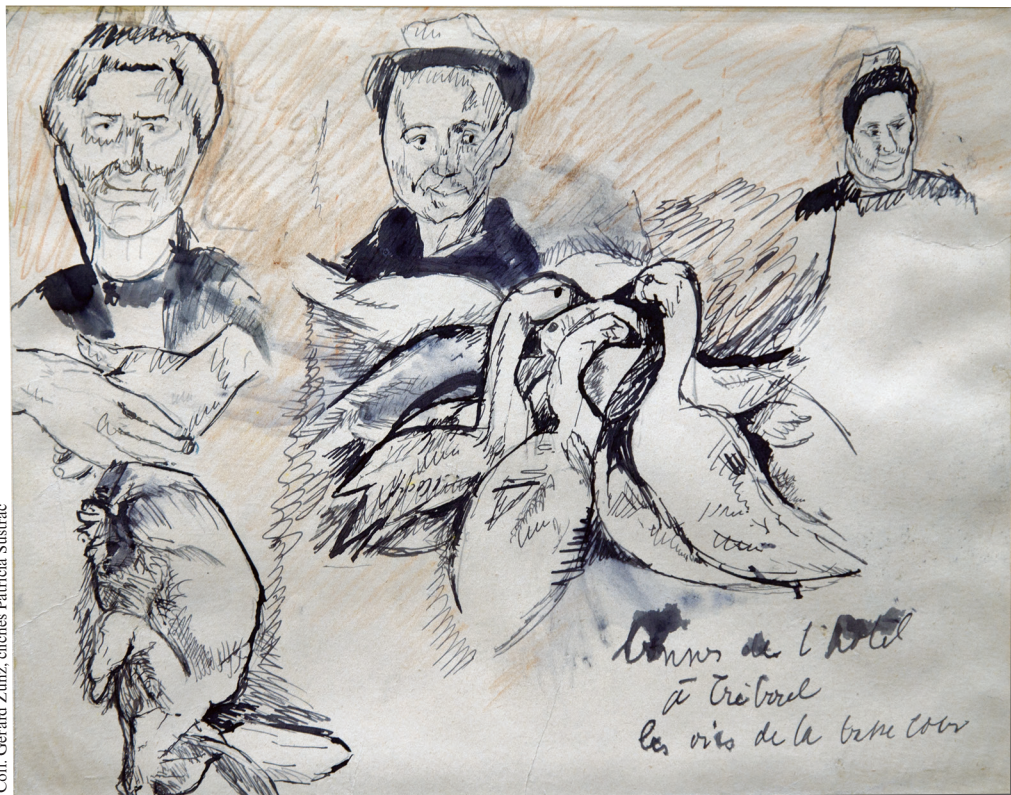
Album breton , « Bonnes de l'hôtel à Tréboul. Les oies de la basse-cour », plume, crayon de couleur marron/ocre, crayon graphite, légendé bas dr., p. 26.