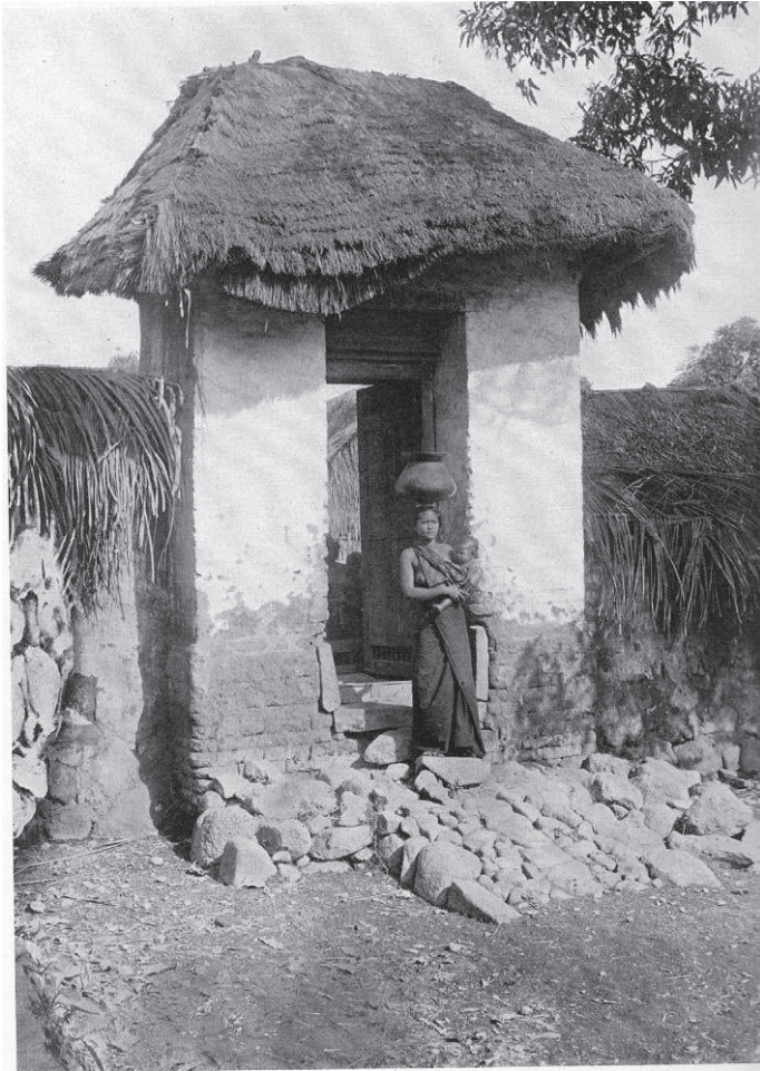
Fig. 2. Porte de maison