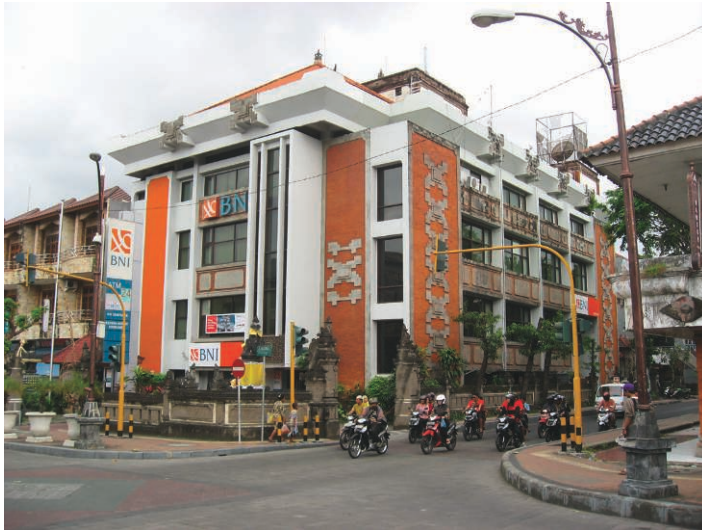
Fig. 6. Édifice en style balinais à Denpasar

Ces éléments sont ceux-ci mêmes qui ont été identifiés par les étrangers comme des marqueurs de Bali, dès le temps des Indes néerlandaises, puis choisis, en raison de leur fort pouvoir d'évocation, pour composer l'architecture néo-régionale appelée le style balinais 32 qui s'est développée dans les années 1980. Les expérimentations sont d'abord limitées à l'application de motifs ornementaux sur quelques points singuliers de la façade, tels les angles et les linteaux ; elles ont progressivement gagné l'ensemble de la composition et de l'esthétique architecturales avec la reproduction de modèles architecturaux et l'introduction d'éléments décoratifs, typiques de la région de Gianyar (sud-est de Bali), dans des édifices modernes fonctionnels, d'abord dans les infrastructures touristiques et les édifices publics puis dans l'ensemble de la production architecturale (fig. 6).