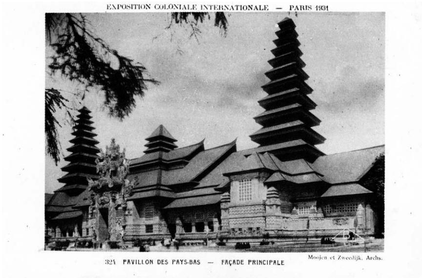
Fig. 3. Pavillon des Indes néerlandaises à l'exposition coloniale de 1931

Auteur : Imp. Braun & Cie, Éditeurs Concessionnaires (Paris), 1931, sources : KITLV 1403951, http://hdl.handle.net/1887.1/item:854103 .