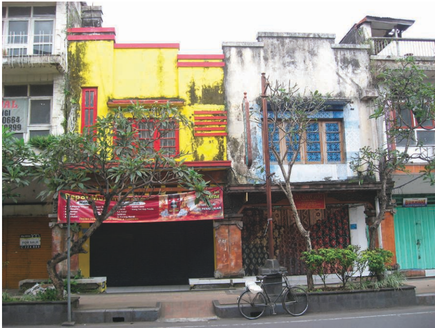
Fig. 7. Compartiments chinois bordant la rue Gajah Mada à Denpasar