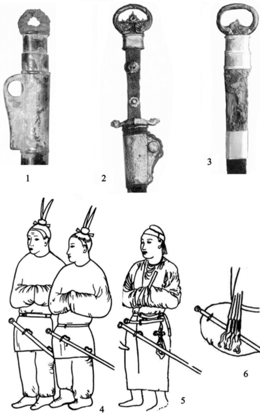
Рис. 3. Восточные параллели клинкового оружия с кольцевым навершием:

1 – округ Гоюань, погребение генерала Ли Сианя (династия Северная Чжоу – 557–581 гг.); 2 – Бейюешань, около г. Лоян, провинция Хенань, погребение (?) (династия Суй – 581–618 гг.); 3 – Чаньань провинция Шаньси, погр. 46 кладбища фамилии Вей (династия Тан – 618–907 гг.); 4–6 – Афрасиаб, «Зал послов», западная стена. Изображения иностранных посольств.