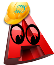
Figure 2 : (a) Listing des points vus comme des outils pédagogiques et choix réalisés par le groupe de première année (b) Mascotte du module (Avogadraw)