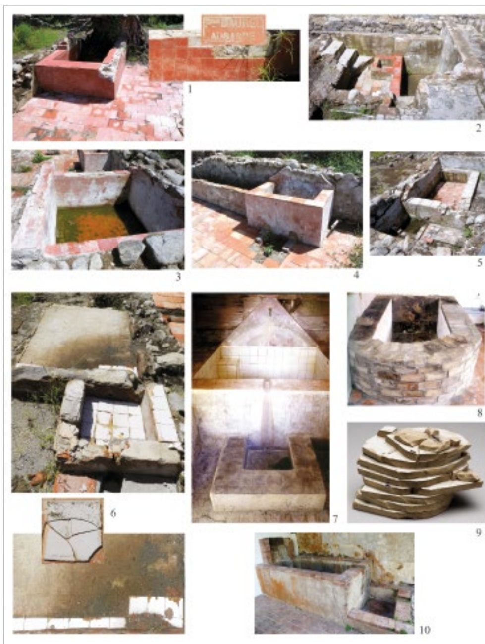
fig. 6 – nn. 1-6, chambres à bain en carreaux de Provence, Allée Pécoul, St-Pierre, fouille EVEHA 2014; nn. 7-8, 10, baigns dans habitations privées, Martinique (FLOHIC 2012); n. 9, pile de carreaux émaillés, Musée de St-Pierre.

pratiquait l'hydrothérapie, les cuvettes latrines en terre vernissée provençale, très en avance sur leur temps (fig. 4, nn. 8-9).